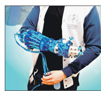
Она поможет бороться со спастикой (непроизвольным напряжением мышц, препятствующим нормальной работе) кистей в автоматическом режиме, то есть заменит работу физиотерапевтов. Разработка ученых позволяет контролировать нагрузку отдельно для каждого пальца, в зависимости от того, насколько сильно они поражены. В перспективе исследователи планируют добиться контроля над каждой фалангой, чтобы иметь возможность максимально точно настроить.

В Сеченовском университете создали уникальную перчатку для пациентов, перенесших инсульт