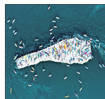
Водный вид спорта, в котором серфер, стоя на доске (сале), гребет веслом, а не руками, как в классическом серфинге) Они находят большую льдину, добираются до нее на салах, а потом совместными усилиями перегоняют на другое место.

Все дело в традиционном мероприятии, которое местные любители сапов устраивают каждый год в честь начала сезона. (Салп-серфинг — водный вид спорта, в котором серфер, стоя на доске (сале), гребет веслом, а не руками, как в классическом серфинге) Они находят большую льдину, добираются до нее на салах, а потом совместными усилиями перегоняют на другое место.