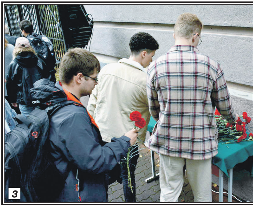
1. Губернатор Тульской области А.Г. Дюмин выступает на митинге, посвященном открытию мемориальной доски 2. Мемориальная доска, память о К.Н. Рудневе 3. Студенты возлагают цветы к мемориальной доске