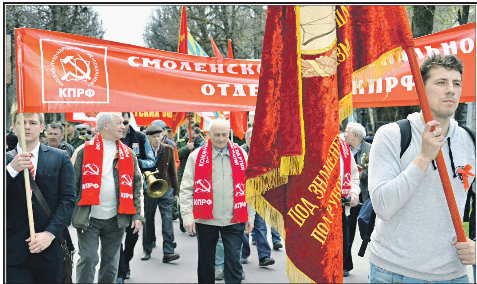
Фото из альбома смоленских маевок