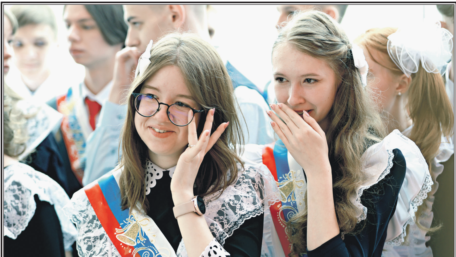
Выпускники во время празднования Последнего звонка