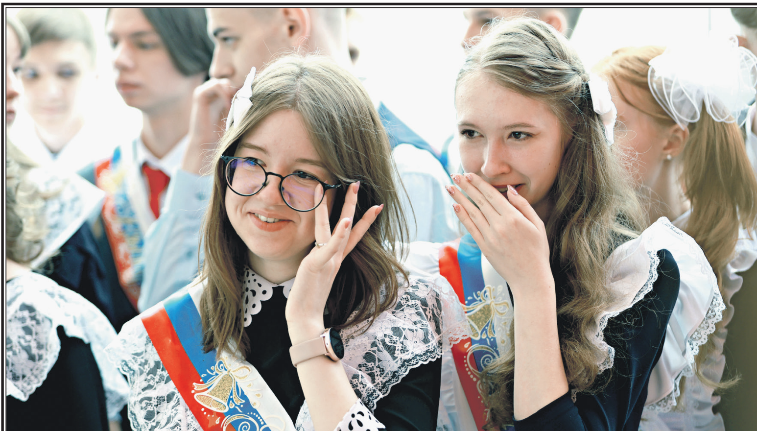
Выпускники во время празднования Последнего звонка