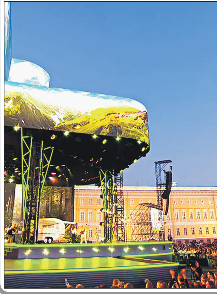
Материал подготовлен пресс-службой Пятого канала

Праздник «Алые паруса» был возрожден после многолетнего перерыва в 2005 году по инициативе Акционерного Банка «Россия», правительства Санкт-Петербурга и Пятого канала. Впервые он состоялся 27 июня 1968 года. Идея его появления в Ленинграде в конце 60-х была навеяна романтикой и невероятной популярностью фильма «Алые паруса» по одноименной повести Александра Грина.