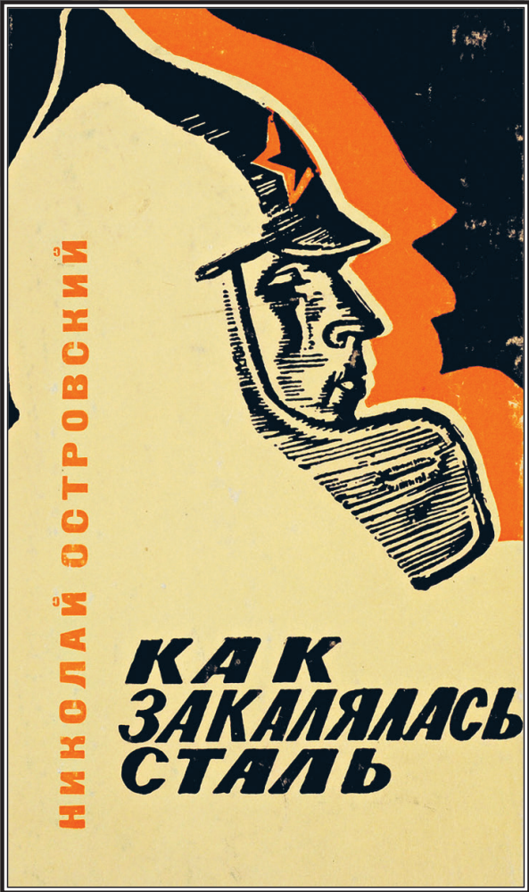
НИКОЛАЙ ОСТРОВСКИЙ КАК ЗАКАЛЯЛАСЬ СТАЛЬ