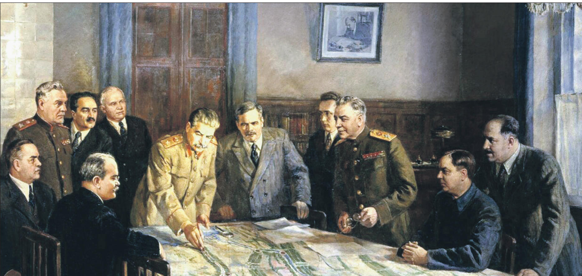
Д. Налбандян. Заседание Политбюро ЦК ВКП(б)

Но читая Ваши статьи, я увидел, что Вы сейчас сами нашли нужное от занятий, посвященных государственному строительству, уделить время на глубокую научную работу по установлению основных законов природы нашей экономической жизни, я решил поставить пе-