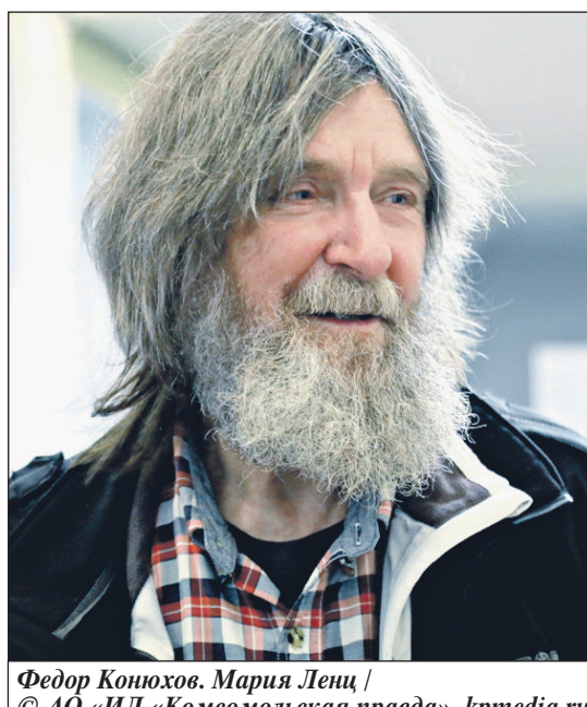
Федор Конюхов. Мария Ленц / © АО «ИД «Комсомольская правда», kpmmedia.ru

Путешественник Федор Конюхов планирует совершить перелет на мотопарплане (он же паралет) с архипелага Земля Фран-