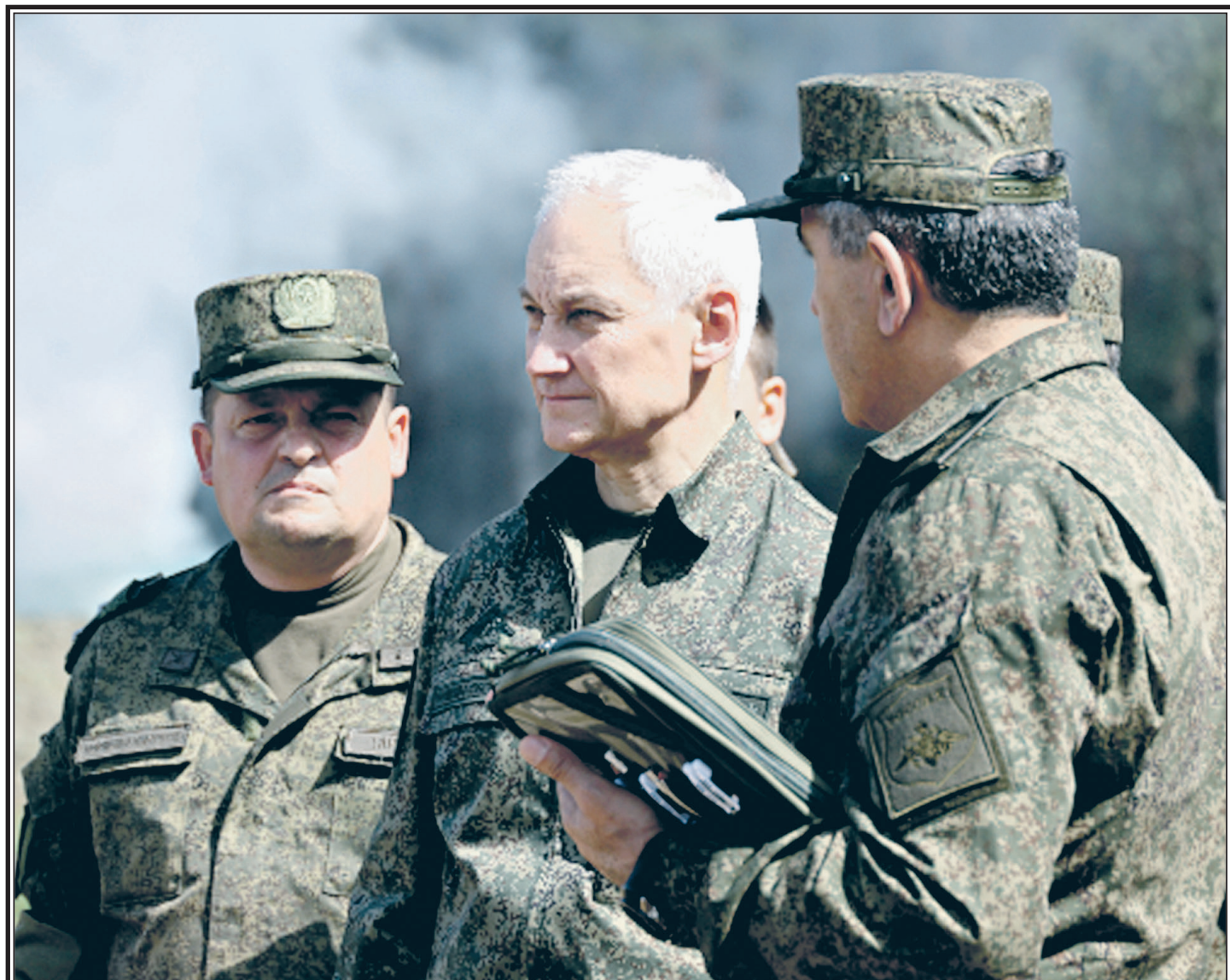
Министр обороны РФ А.П. Белоусов на одном из полигонов Ленинградского военного округа