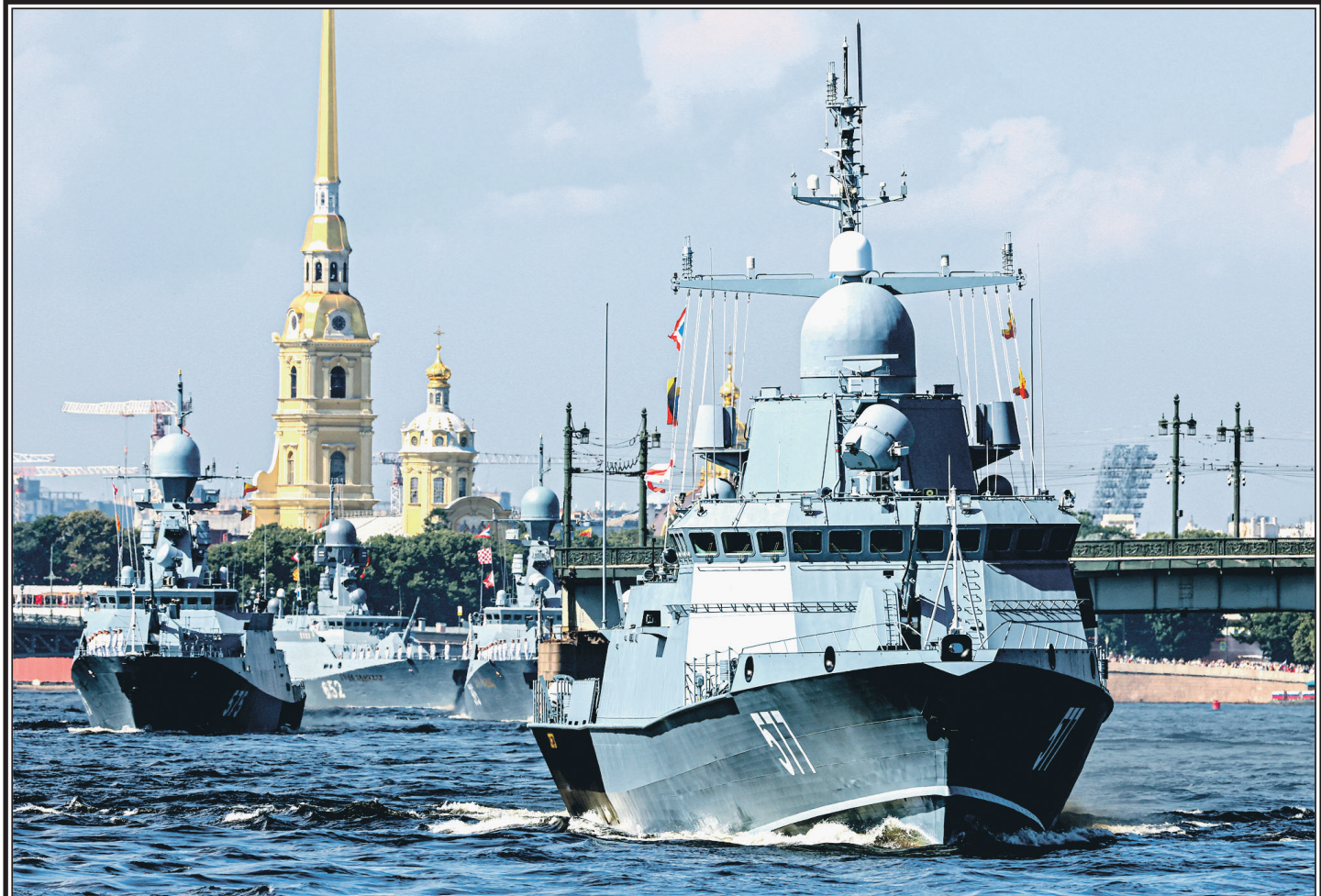
Санкт-Петербург. Малые ракетные корабли «Советск» и «Град» на генеральной репетиции Главного военно-морского парада в честь Дня Военно-Морского флота России