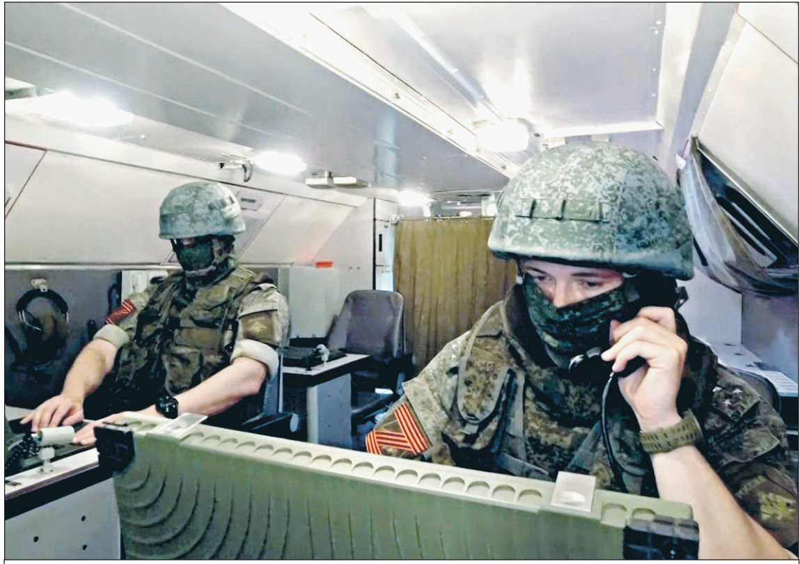
Боевой расчет ОТРК «Искандер».

Всего с начала проведения специальной военной операции уничтожены: 630 самолетов, 278 вертолетов, 28 464 беспилотных летательных аппарата, 556 зенитных ракетных комплексов, 16 684 танка и других боевых бронированных машин, 1390 боевых машин реактивных систем залпового огня, 12 416 орудий полевой артиллерии и минометов, 24 086 единиц специальной военной автомобильной техники.