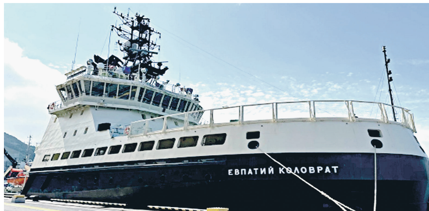
Ледокол «Евпатий Коловрат»