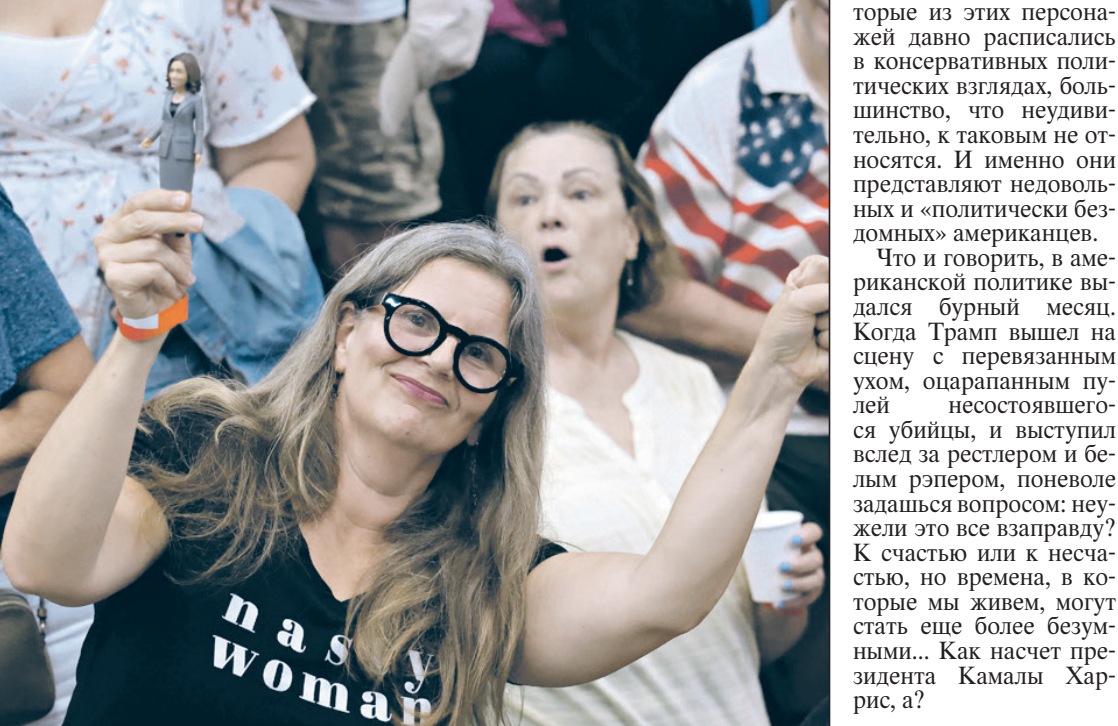
Странники Харрис на митинге в Висконсине.