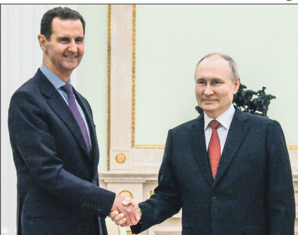
Президент России Владимир Путин и президент Сирии Башар Асад во время встречи в Кремле.