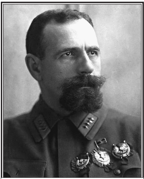
П.Е. Дыбенко – первый нарком ВМФ РСФСР

С праздником вас, военные моряки – гордость и честь нашей державы!