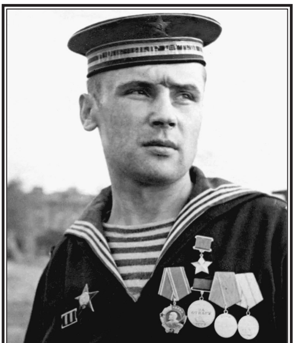
В.Д. Кусков – моторист торпедного катера, Герой Советского Союза