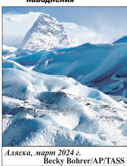
Аляска, март 2024 г.

Более 100 домов и построек ушли под воду после масштабных наводнений на Аляске. Некоторым жителям пришлось эвакуироваться. Озеро, которое образовалось из-за таяния ледника, переполнилось, и вода хлынула вниз, к населенным пунктам. По данным местных СМИ, это происходит ежегодно, но с каждым разом ситуация становится хуже из-за глобального потепления. По словам местных жителей, в этом году наводнения оказались беспрецедентными. Сильнее всего от удара стихии пострадал город Джуно. Местные власти ввели режим ЧС на уровне штата и пообещали жителям оказать помощь в восстановлении домов.