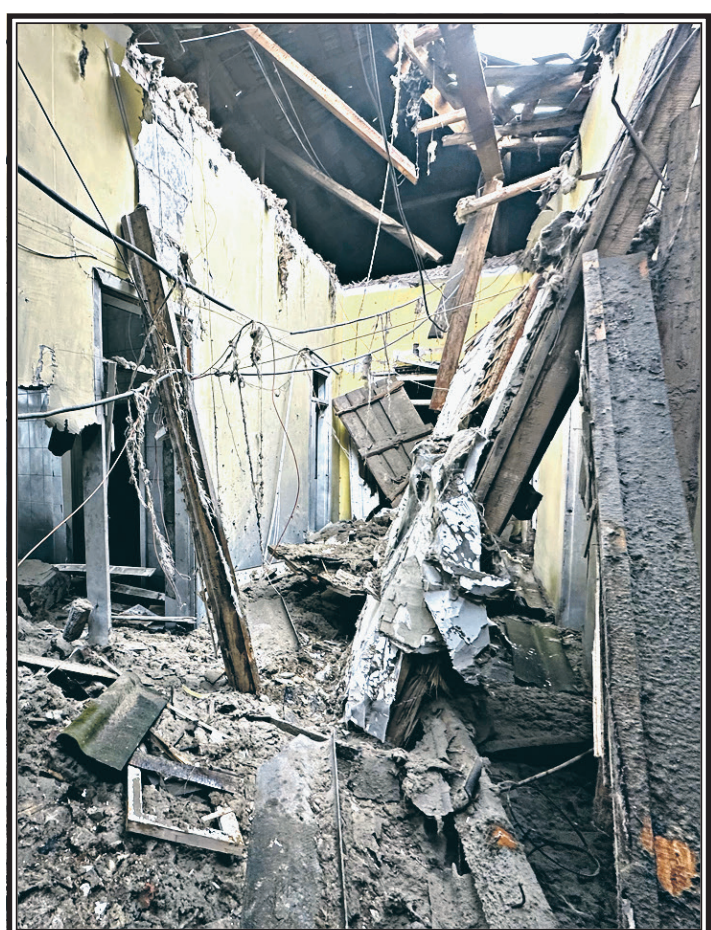
Белгородская область. Город Грайворон. Больница, разрушенная в результате удара ВСУ.

В результате активных действий подразделений группировки войск «Центр» в течение недели освобождены населенные пункты Тимофеевка, Новоселовка Первая и Веселое Донецкой Народной Республики. Нанесено поражение формированиям танковой, пехотной, двух штурмовых бригад ВСУ, двух бригад теробороны и штурмовой бригады «Люти» национальной полиции Украины. Отражены 22 контратаки подразделений против-