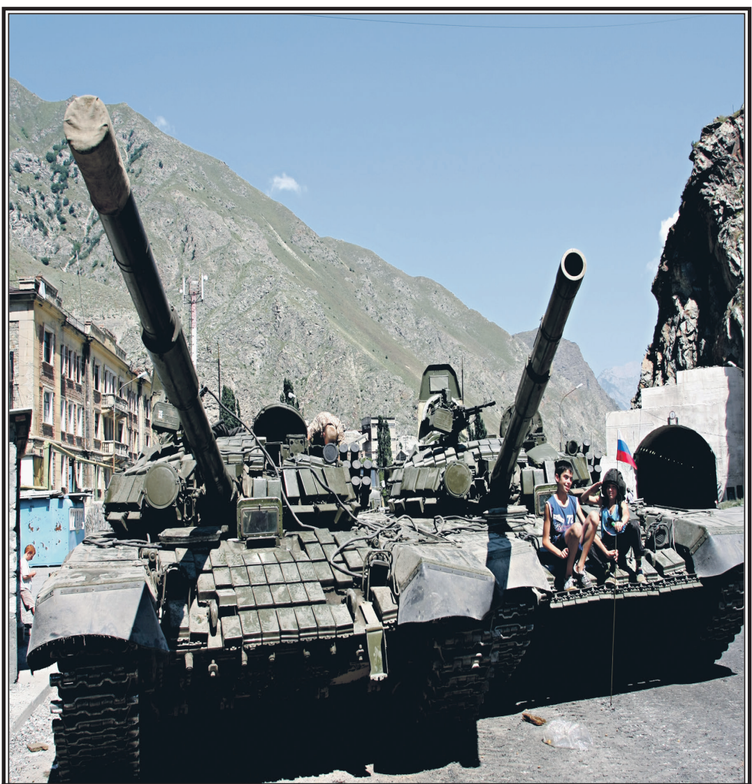
Южная Осетия, 12 августа 2008 г. Российские миротворцы у Рокского тоннеля

8 августа 2008 года стало черной страницей в истории Южной Осетии. В этот день началась вооруженная агрессия, направленная против мирного населения республики, которая навсегда изменила жизнь многих людей и оставила глубокий след в памяти народа.