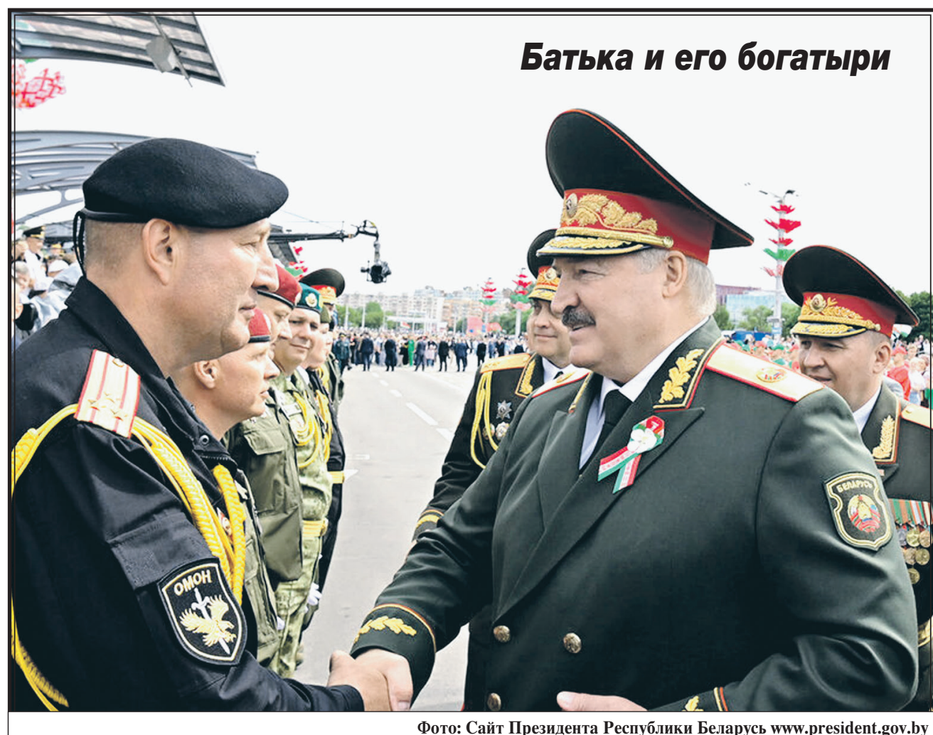
Батяка и его богатыри

— Мы приняли первый гуманитарный груз — от Брянского отделения. Огромное спасибо нашим коллегам, нашим друзьям, товарищам. Незамедлительно будем доставлять все нашим жителям — беженцам из приграничных районов, где сегодня идут боевые действия, где гибнут мирные жители. Мы благодарим всех наших товарищей из других областных организаций КПРФ, потому что все откликнулись на нашу беду. Уже сейчас идут следующие конвои от Коммунистической партии Российской Федерации. Мы уверены: Победа будет за нами! За свою! За Родину! За Победу!