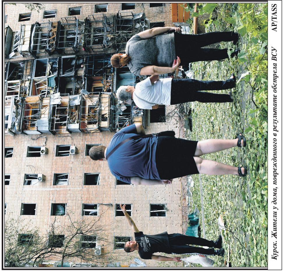
Курск. Жители у дома, поврежденного в результате обстрела ВСУ

пос. Строитель, Тамбовский гор. округ, Тамбовская обл.