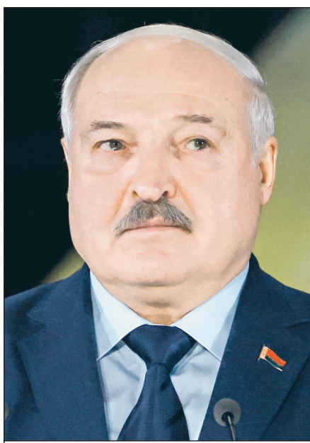
Президент Республики Беларусь Александр Лукашенко.