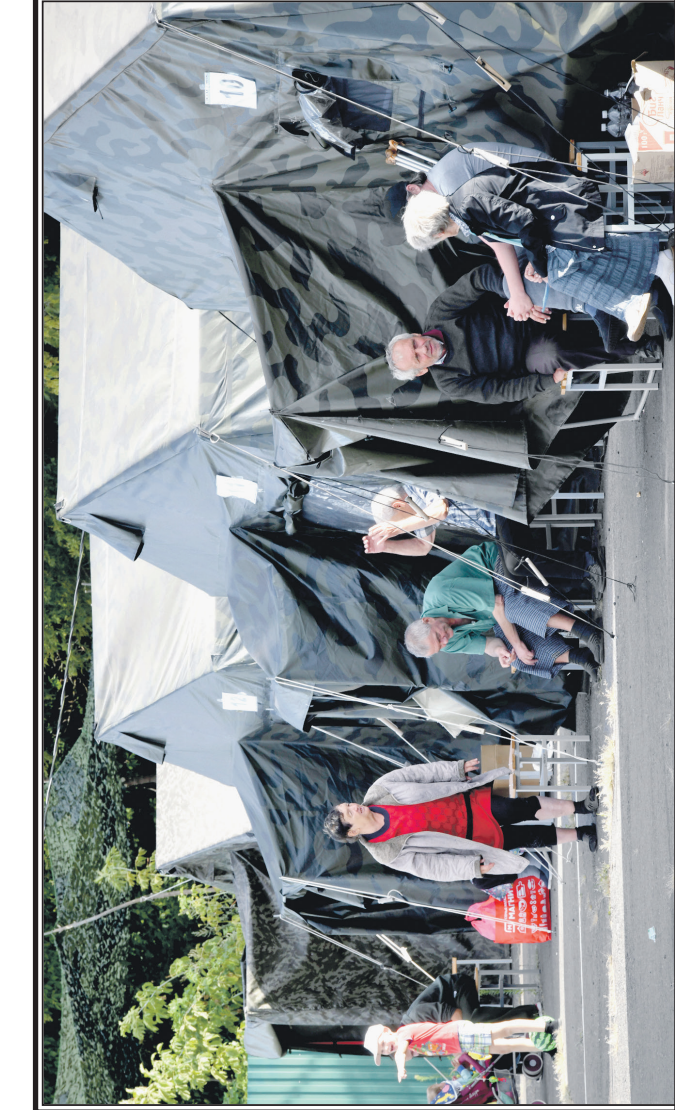
Эвакуированные жители приграничных районов Курской области