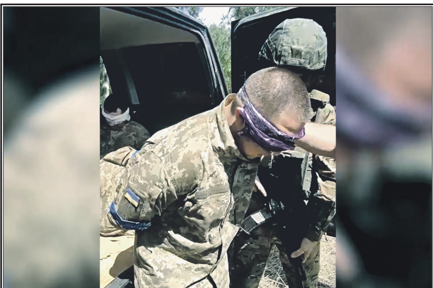
Один из взятых в плен 14 августа в Курской области военнослужащих ВСУ

Операция по уничтожению формирований ВСУ продолжается.