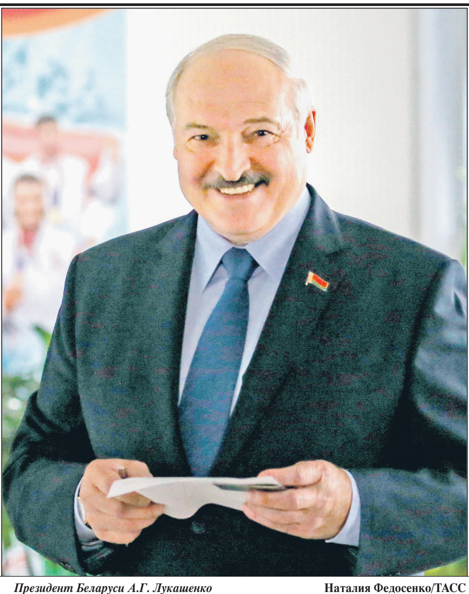
Президент Беларуси А.Г. Лукашенко