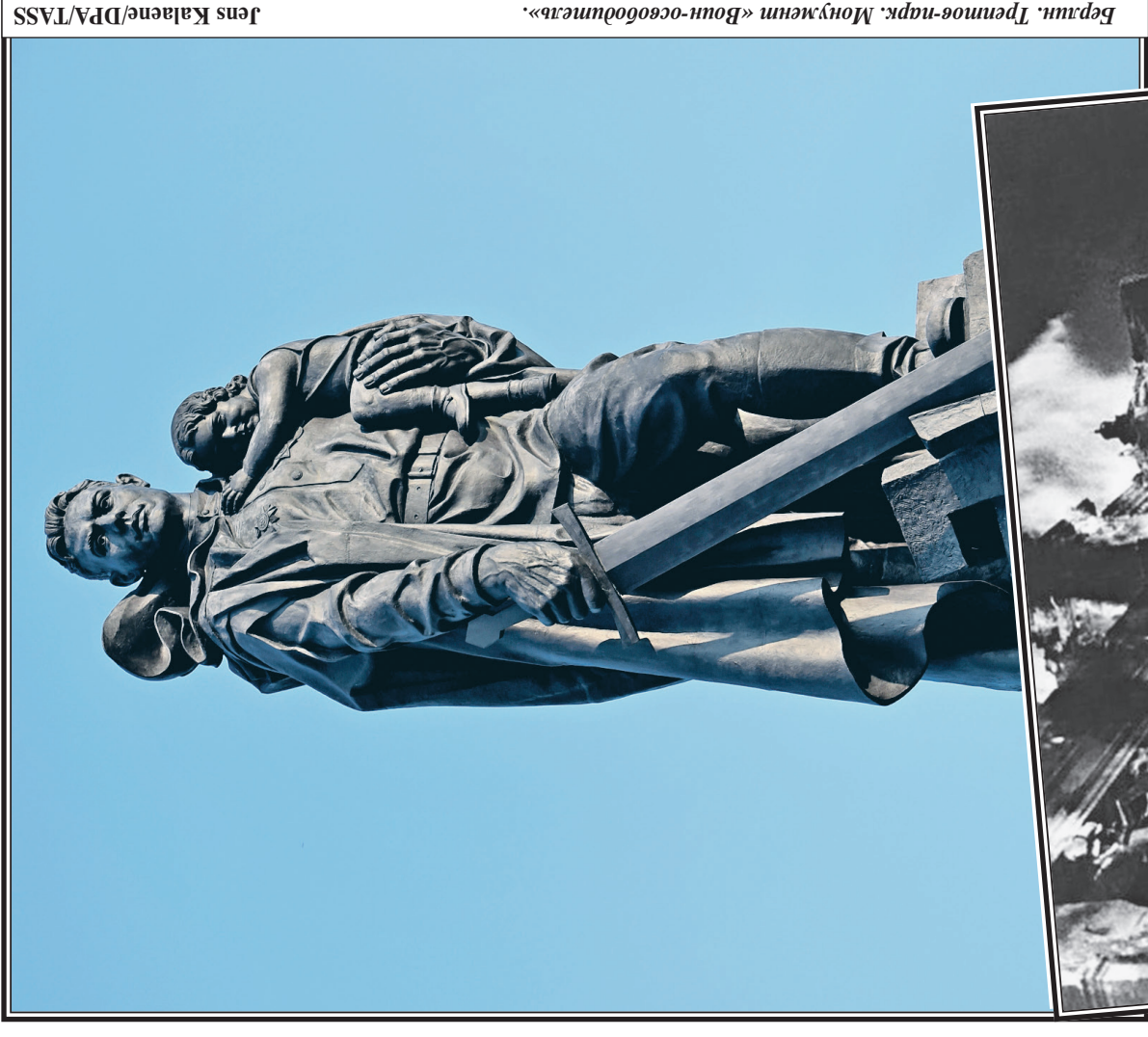
Берлин, Третье-имперское Рейх, 1945 г.