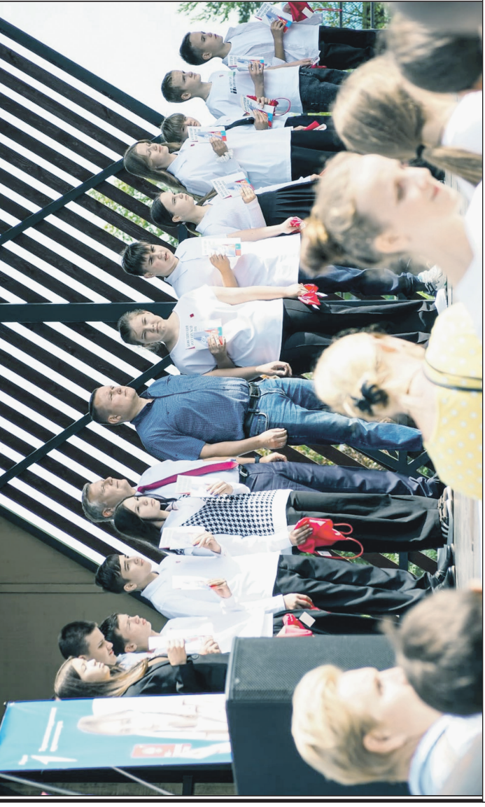
На празднике «До свидания, лето! Здравствуй, школа!».