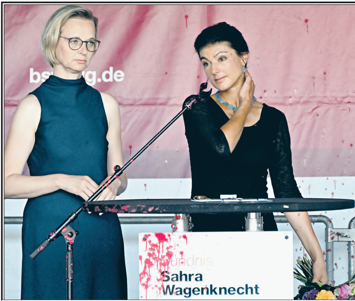
Эрфурт, 29 августа 2024 г. Лидер партии BSW Сара Вагенкнехт (справа) и глава отделения BSW в Тюрингии Катя Вольф на сцене после того, как неизвестный обидел Вагенкнехт красной жидкостью во время ее предвыборного выступления.

«Потому что многих людей», — добавила она, — «понятия «правые» и «левые» сегодня лишь сеют путаницу».