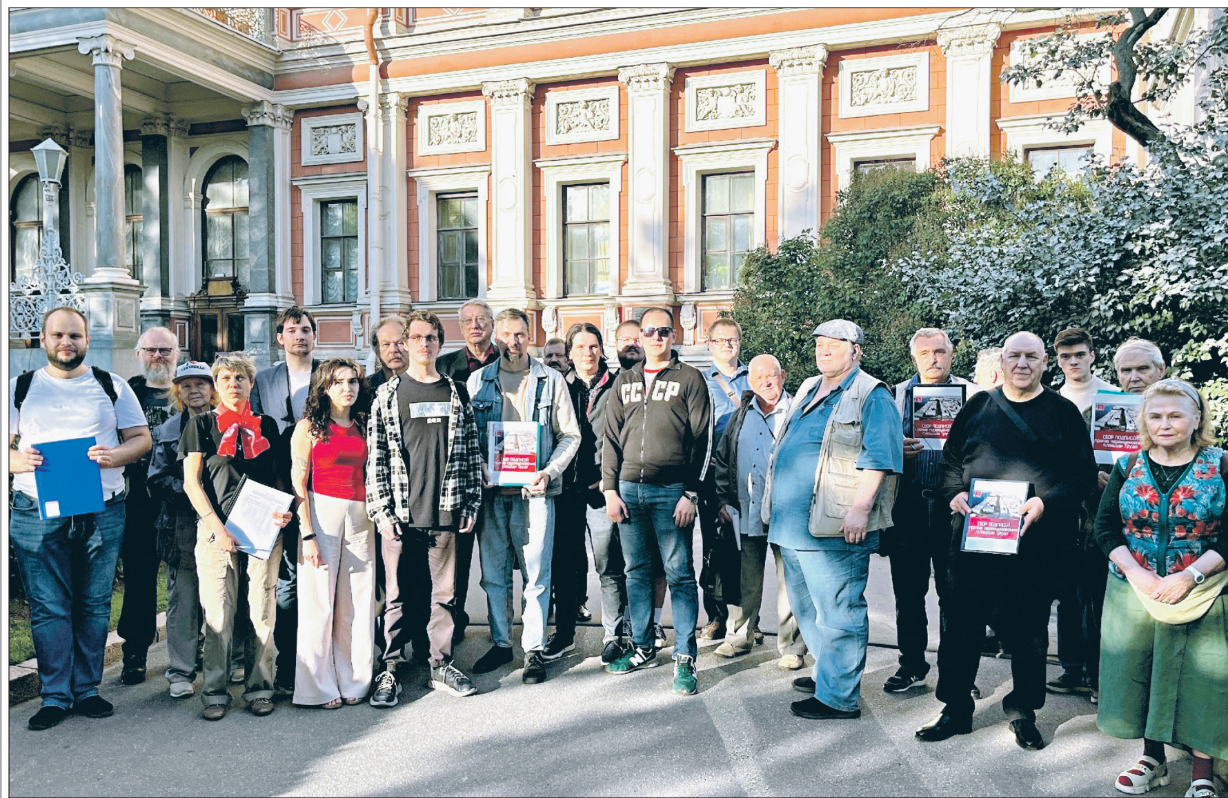
Коммунисты и комсомолы Ленинграда за сохранение исторического названия площади Труда. Александр Рогожкин/Санкт-Петербургское городское отделение КИПРФ