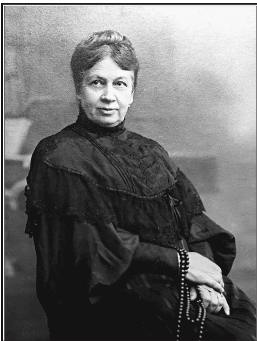
Софья Андреевна Толстая