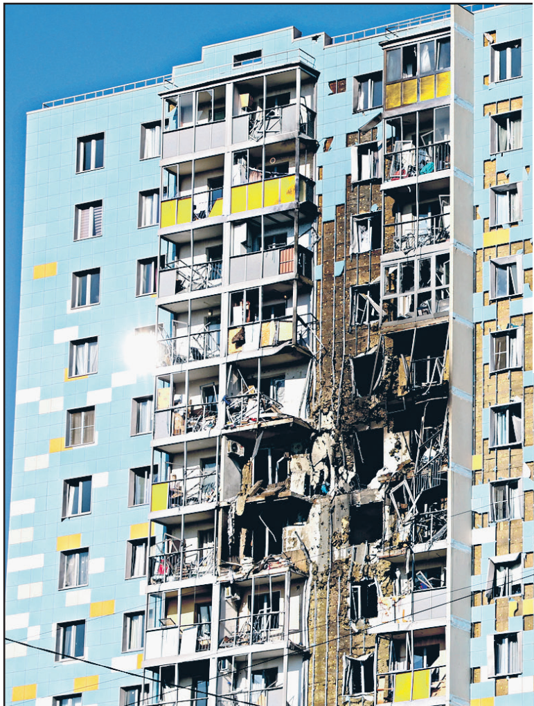
Московская область. Раменское. 10 сентября 2024 г. Девять утра. Многоквартирный дом в Спортивном проезде после террористической атаки украинского БПЛА.

С этим сложно не согласиться. Как и с теми экспертами, которые считают, что массированный «обход» беспилотниками наших систем ПВО был бы невозможен без разведанных НАТО. Более того, фашисты-бандеровцы, сидящие по подвалам в ожидании ударов армии России, не смогли бы сами собрать все эти ударные беспилотники и организовать такую атаку. Все