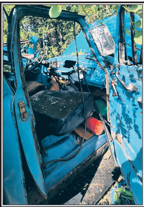
Атаки против мирных жителей – обычное дело среди востушников.

В районе села Байцурь Борисовского района на гражданский грузовой автомобиль атакован дроном ВСУ. Ранен мужчина. Пострадавшего в тяжёлом состоянии с осколочными ранениями головы и грудной клетки попутным транспортом доставили в Борисовскую ЦРБ. После оказания медицинской помощи он будет переведен в областную клиническую больницу. Информация о последствиях уточняется.