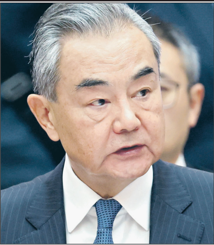
Глава МИД КНР Ван И на встрече представителей государств БРИКС и «БРИКС плюс» в Санкт-Петербурге 11 сентября 2024 года.

ПЕКИН Глава китайского МИДа Ван И заявил, что Китай будет способствовать дальнейшей консолидации БРИКС. Об этом дипломат заявил на встрече представителей стран БРИКС, курирующих вопросы безопасности. Дипломат также подчеркнул, что Китай видит развитие объединения приоритетом своей политики и поддерживает председательство России.