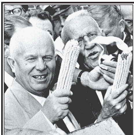
Никита Хрущев и американский фермер Росалл Гаст на ферме последнего в Айове 23 сентября 1959 г. Американец сумел убедить Хрущева начать массовое разведение кукурузы в СССР. Долгосрочные последствия этого ныне всем известны...

Операция по уничтожению формирований ВСУ продолжается.