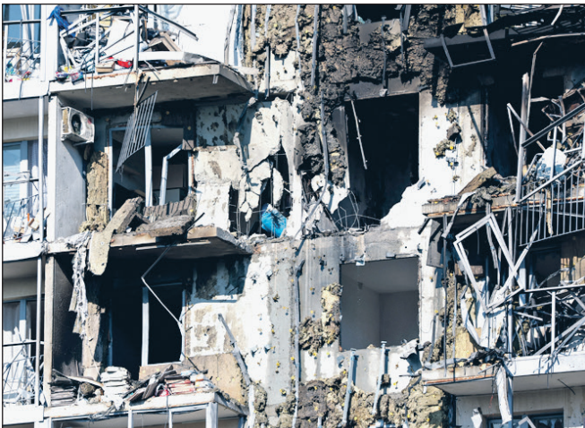
Раненый дом вблизи.

Работники одного из предприятий по производству кирпича и керамических изделий добились от работодателя выплаты задержанной зарплаты. Всего местный бизнесмен задолжал более семи миллионов 91 работнику. После обращения двоих пострадавших в прокура-