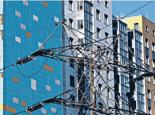
Раненый дом вблизи.

туру задолженность была погашена. Против не выплачивавшего зарплаты бизнесмена возбуждено уголовное дело.