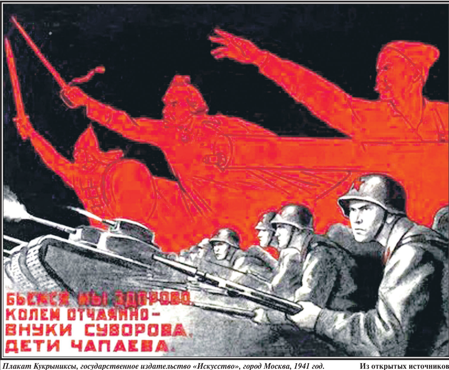
Плакат Куркрынскы, государственное издательство «Искусство», город Москва, 1941 год.