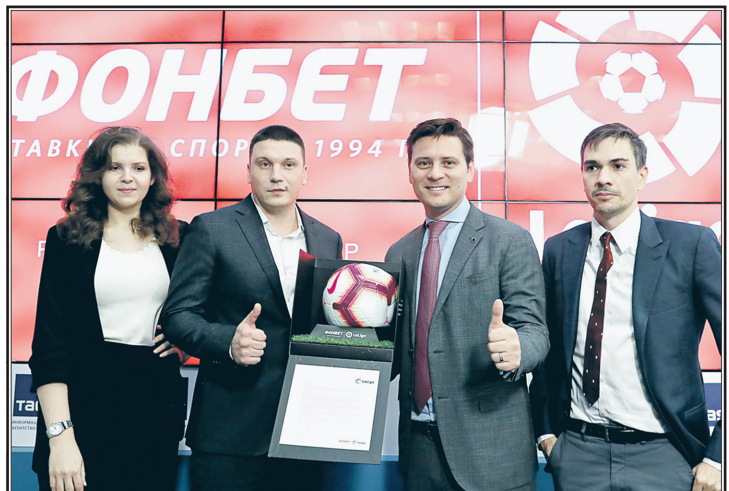
Москва, 2018 год. Церемония подписания соглашения между букмекерской компанией «Фонбет» и чемпионатом Испании по футболу.

полный текст материала, подготовленного ИА «Равенство. Медиа», размещен на сайте газеты «Советская Россия» sovross.ru.