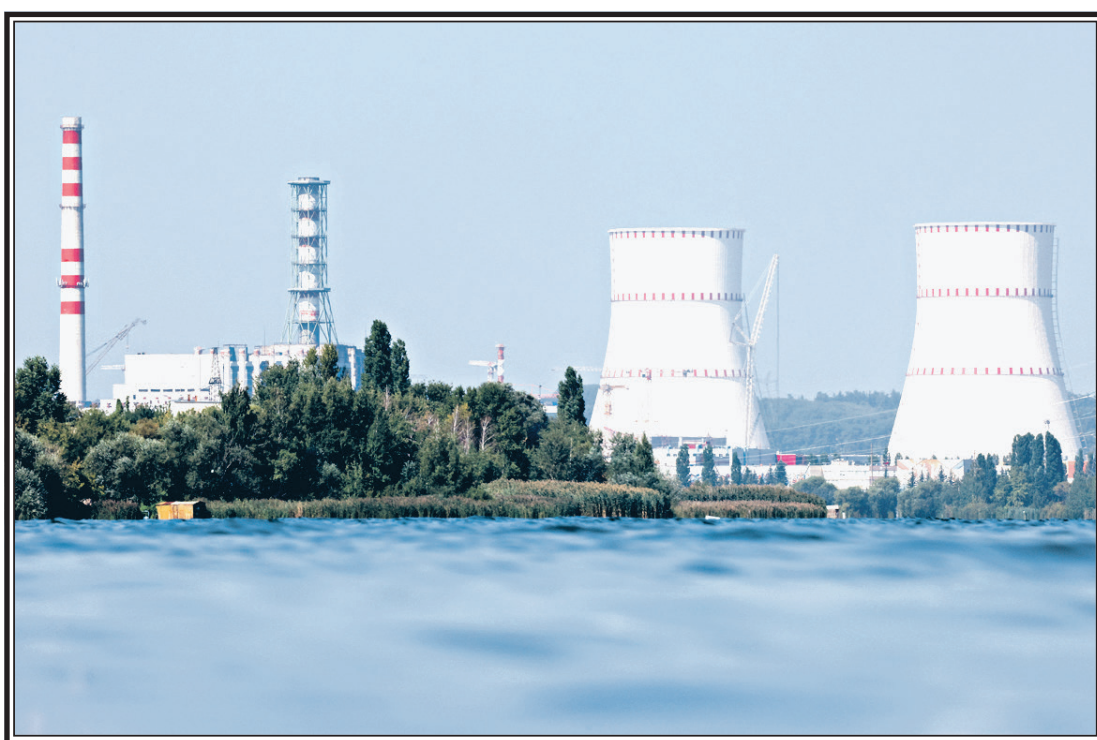
Курская область, город Курчатова. Вид на Курскую атомную электростанцию.

Генеральный директор Международного агентства по атомной энергии (МАГАТЭ) Рафаэль Гросси после своего недавнего визита в Курск, состоявшегося 27 августа, заявил, что ни при каких обстоятельствах нельзя осуществлять атаки на атомные электростанции. «Несколько дней назад я посетил Курск, где ситуация довольно серьезная. В связи с этим я говорю, что ни одна гражданская атомная электростанция никогда не должна подвергаться нападению, ни при каких обстоятельствах, вне зависимости от того, где эти станции расположены», — сообщил Гросси на открытии Генеральной конференции МАГАТЭ в Вене.