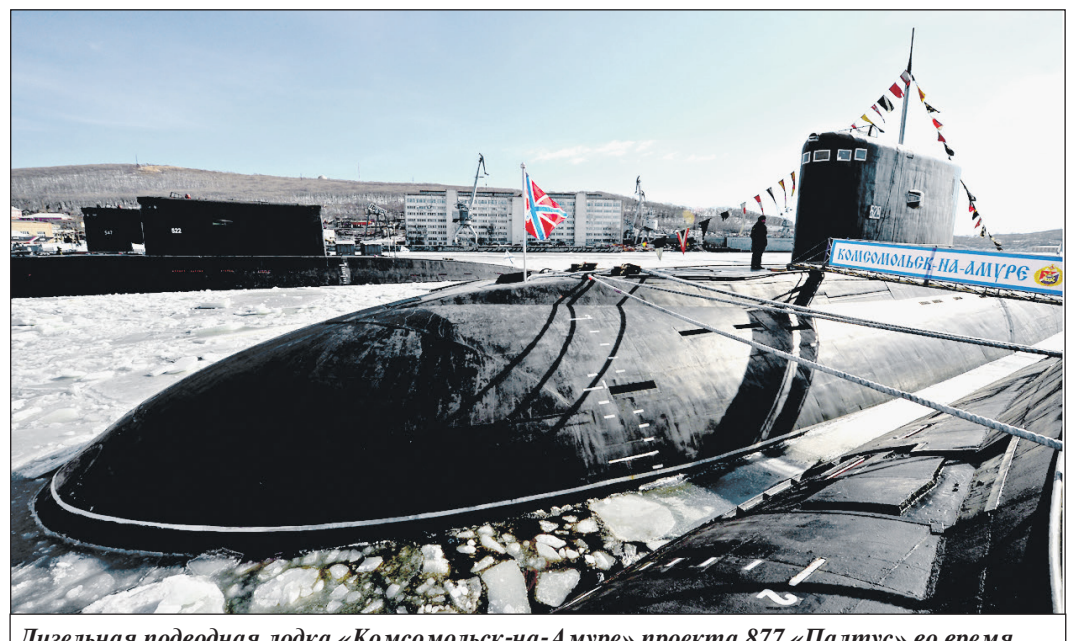
Дизельная подводная лодка «Комсомолец-на-Амуре» проекта 877 «Палтус» во время торжественной церемонии ввода в боевую строй Тихоокеанского флота после ремонта и модернизации на Амурском судостроительном заводе.

Подводные лодки класса «Палтус» относительно медленные. Они развивают скорость до 17 узлов на поверхности, до 20 узлов под водой. Кроме того, они не могут работать на больших глубинах — в отличие от атомных. Предельная глубина погружения составляет 300 метров, а рабочая — 240. Однако при за-