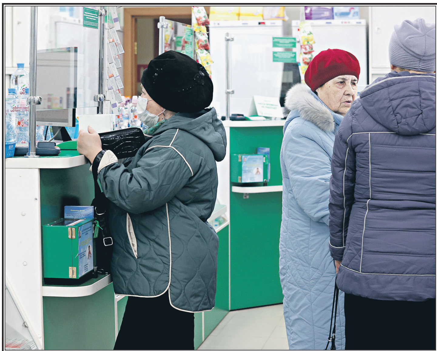
Пенсионеры в аптеке.