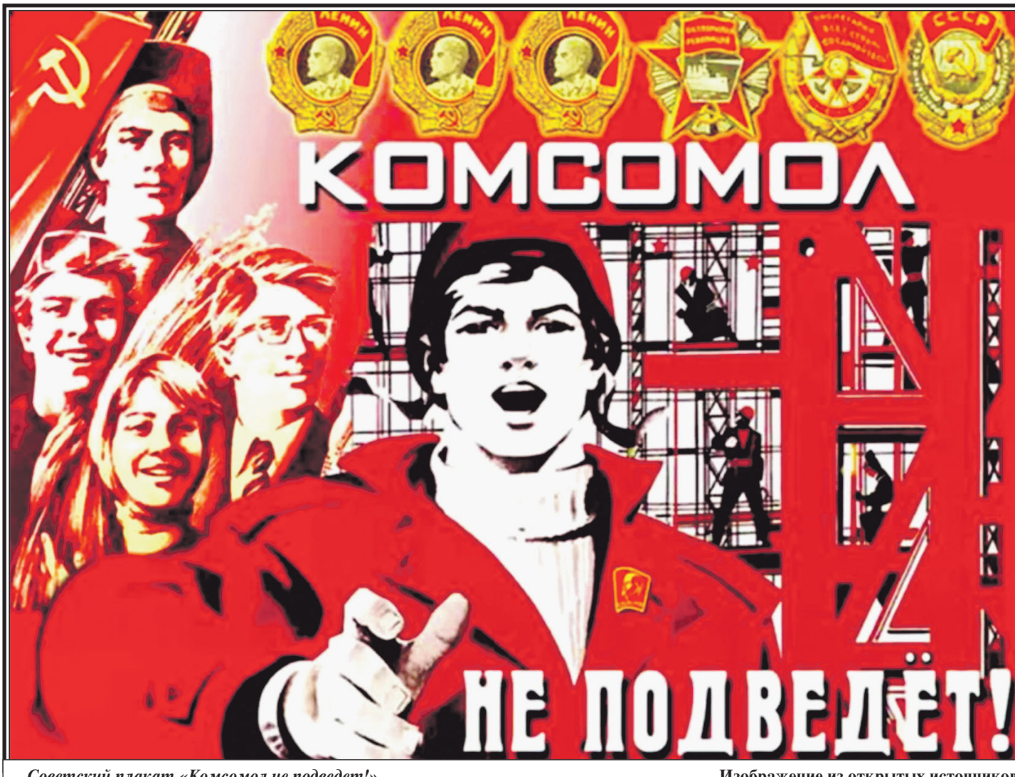
Советский плакат «Комсомол не подведет!»

Именно Комсомол показал нам этот пример. Поэтому еще раз поздравляю вас с праздником – Днем рождения Ленинского Комсомола!