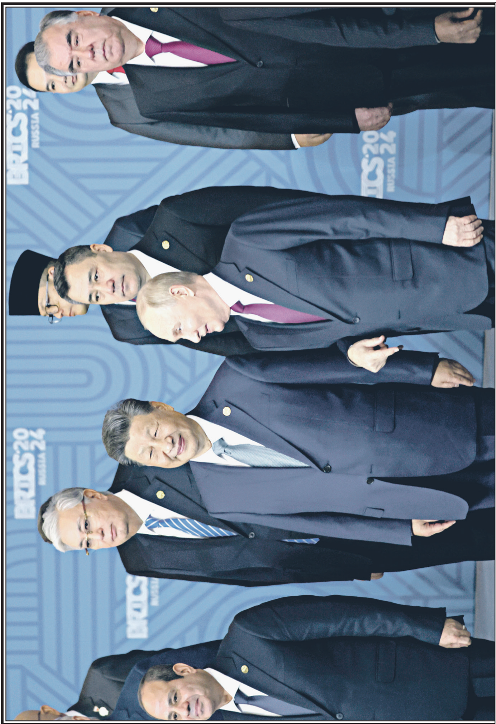
Казань, 24 октября. Совместная фотосессия участников пленарного заседания саммита БРИКС.