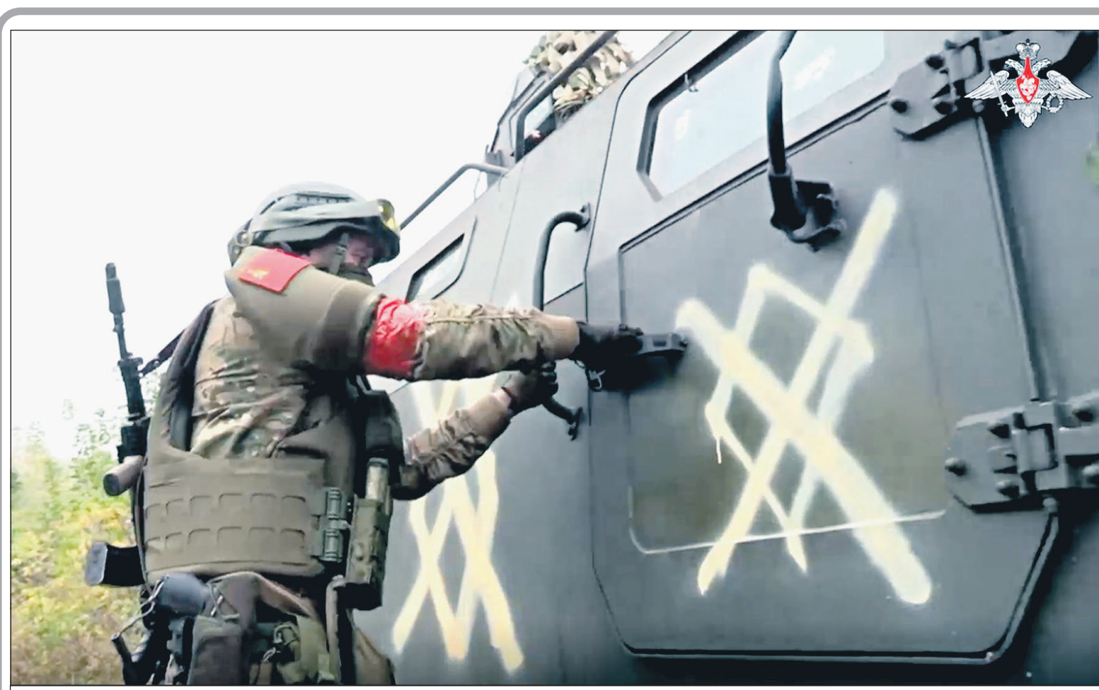
Десантник у трофейного броневомобиля «Козак» в Курской области.

«Собранные вместе, эти работы раскрывают круг проблем, волновавших художников и общество, обозначают особенности их творческого метода и намекают на путь в искусство последней трети XIX – начала XX века. Критические высказывания современников раскрывают о сложности восприятия, а хроника деятельности товарищества и архивные документы воссоздают историю в фактах и покажут многогранность деятельности товарищества как независимого просветительского объединения художников», – говорится в сообщении на сайте Третьяковской галереи.