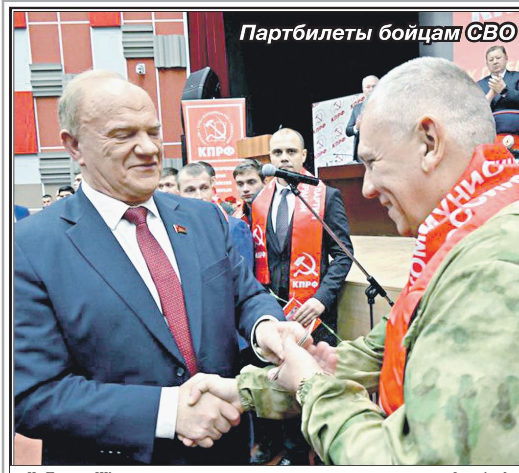
На Пленуме ЦК

Современный Комсомол продолжает традиции своих предшественников. Нынешние комсомольцы, как и в годы Великой Отечественной войны, грудью встали на защиту Родины от коричневой чумы. Они проявляют мужество и отвагу в борьбе со смертельным врагом – во имя Победы. И эта Победа обязательно будет!