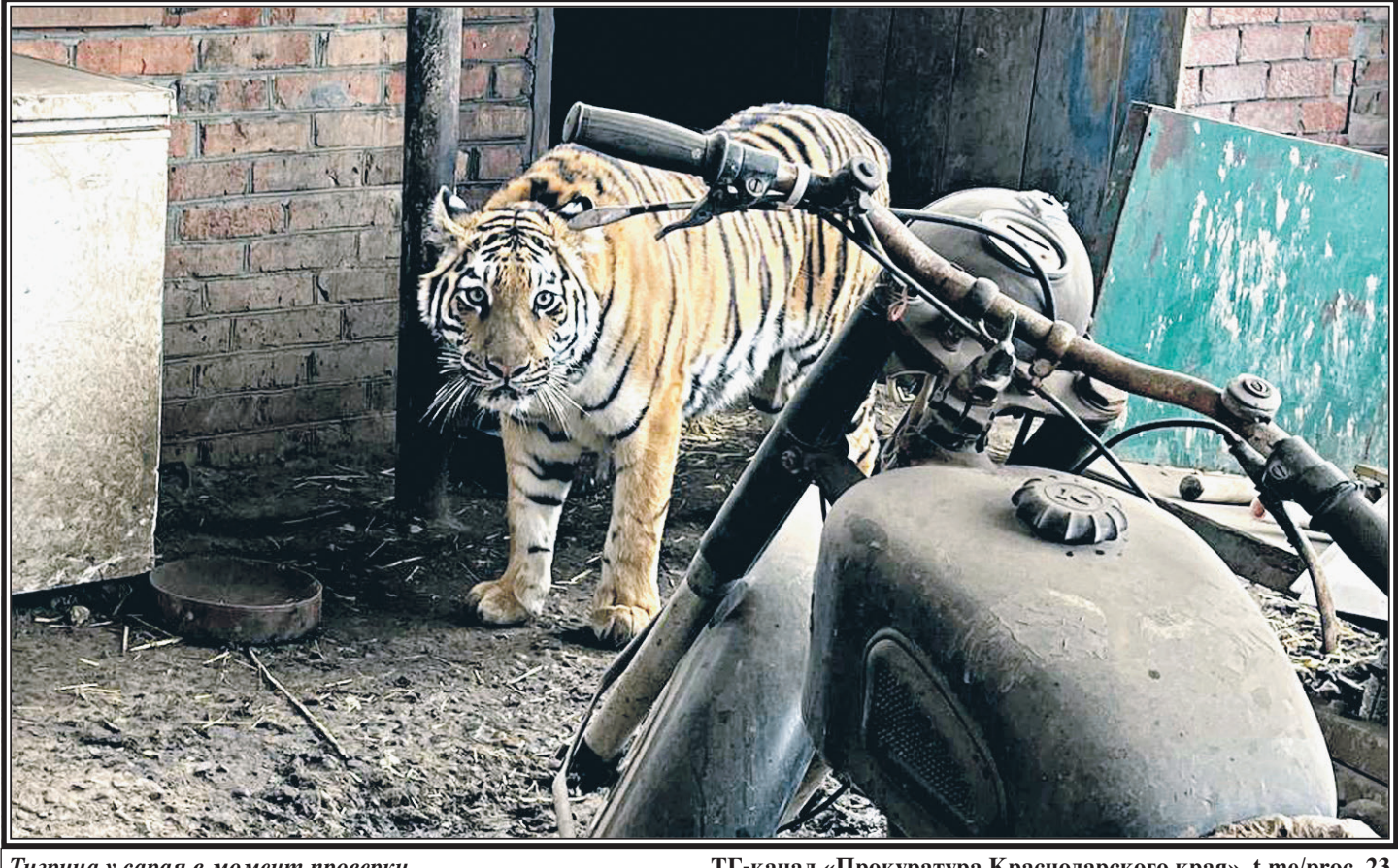
Тигрица у сарая в момент проверки.

По итогам проверки органами было принято решение об изъятии тигрицы и помещении ее в специальное учреждение, так как проживание хищника в сарае создавало угрозу жизни и безопасности людей. Хозяин не был согласен с изъятием и оказал сопротивление. Он попытался вывезти животное на своем автомобиле и спрятать – в итоге был задержан сотрудниками полиции, которые составили административный протокол о неповиновении законному распоряжению или требованию сотрудника (ч. 1 ст. 19.3 КоАП РФ). Увезти тигрицу мужчина пытался, скорее всего, не от большой любви к «питомцу». По свидетельствам производителей изъятия сотрудников, он неоднократно избил животное прямо в их присутствии. Материал о жестоком обращении с животным уже рассматривается правоохранителями. А тигрица теперь находится в специализированном учреждении, где определит ее дальнейшую судьбу – жить стало спокойнее и соседям мужчины, и, скорее всего, самому животному.