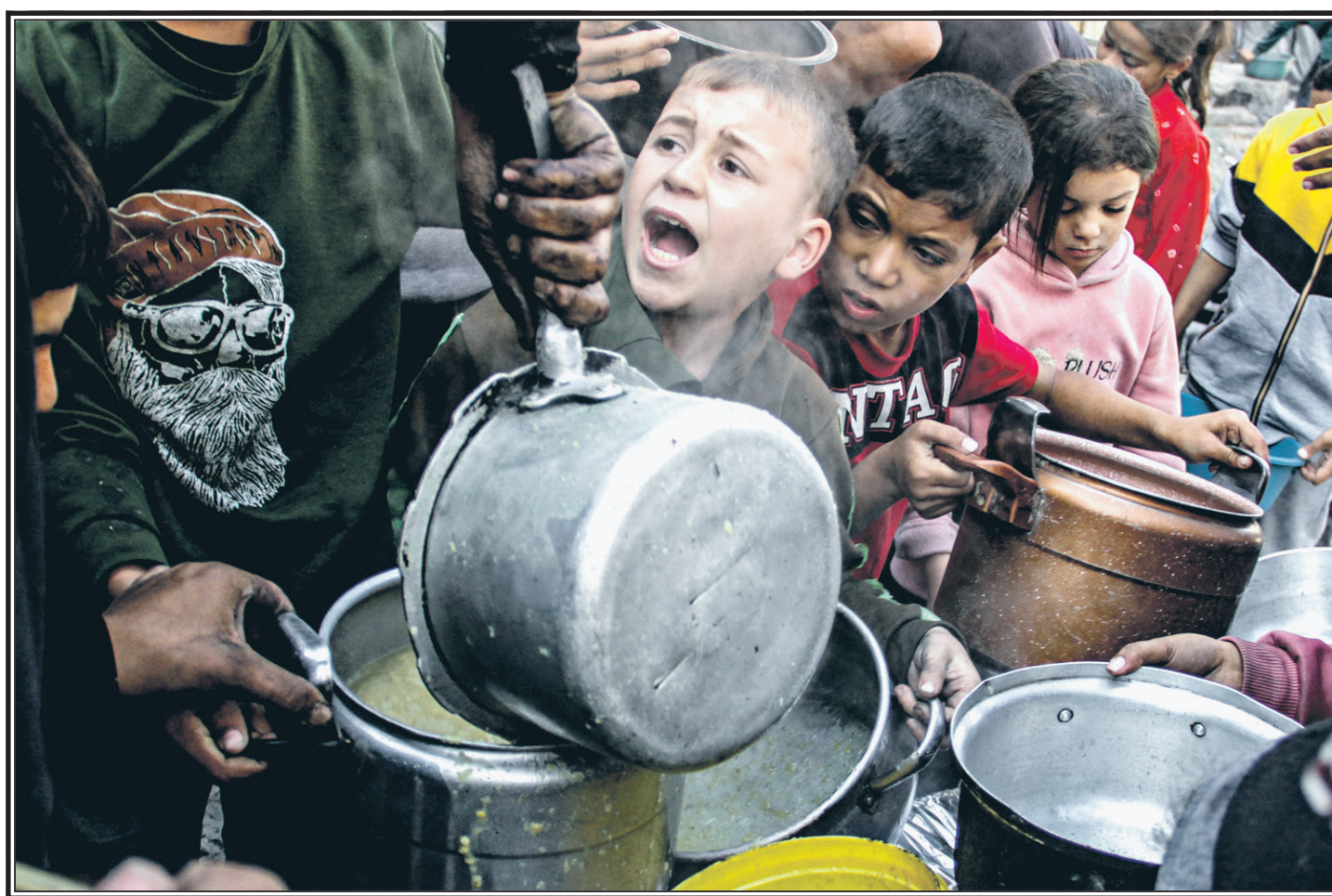
Раздача продовольственной помощи в Газе.

На Эльбурсе планируют воссоздать легендарную гостиницу «Приют одинокадьи». Когда-то это был самый высокогорный отель Европы, он располагался на высоте 4050