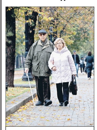
Пенсионеры в Москве

Треть населения России составляют люди старше 55 лет. Об этом сообщило Министерство труда. При этом доля таких граждан постоянно увеличивается. На начало 1990 г. их было 21,1%, в 2025-м — 27,3%, в 2020-м — 29,4%, сейчас уже треть. Зато министерство обещает к 2030 г. сократить численность россиян старше трудоспособного возраста. К цифре 32,9 млн человек должно привести повышение пенсионного возраста.