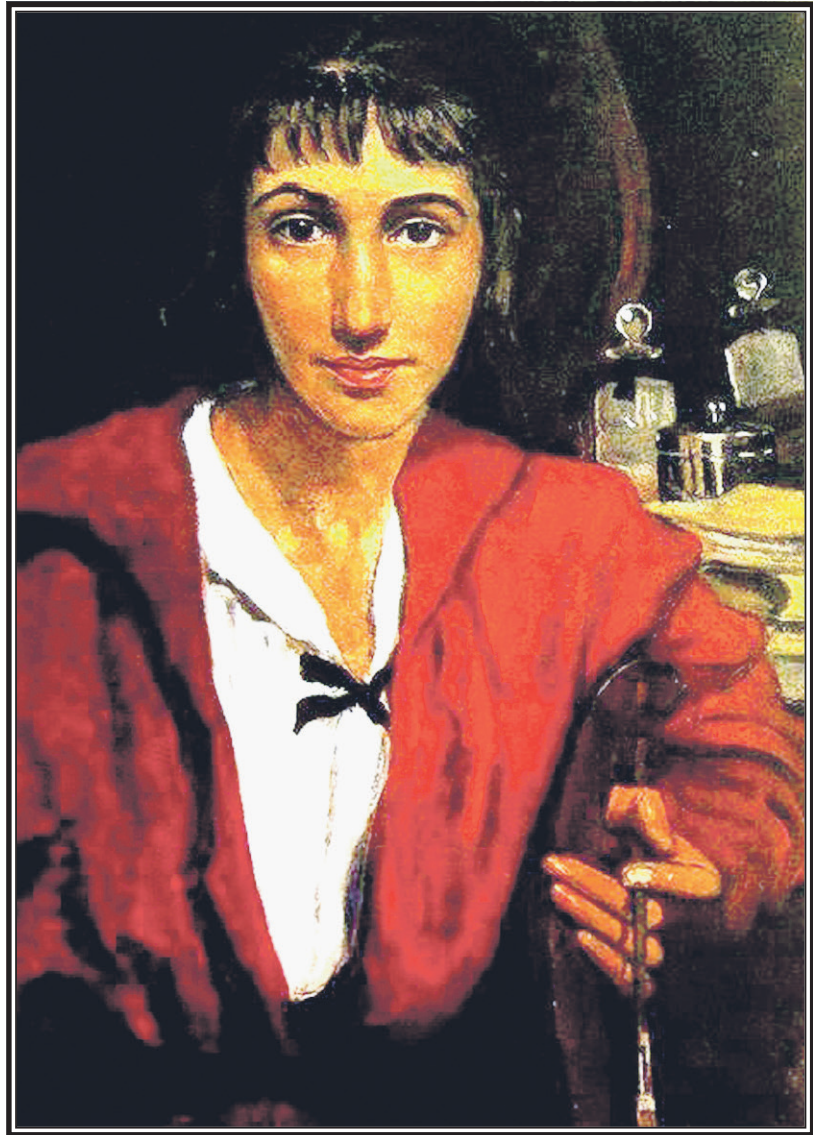
З.Е. Серебрякова. Автопортрет в красном (1921)

В 1924 году Зинаида Евгеньевна вместе с двумя детьми прибыла во французскую столицу. Но этим мечтаньям было, увы, не суждено сбыться. У нее все-таки были немногочисленные заказы, но заказчики были чрезмерно взыскательными. Помимо передачи сходства, они требовали украшения своей внешности. Им нужно было сделать портрет в стиле Веронезе или Гойи, то у-