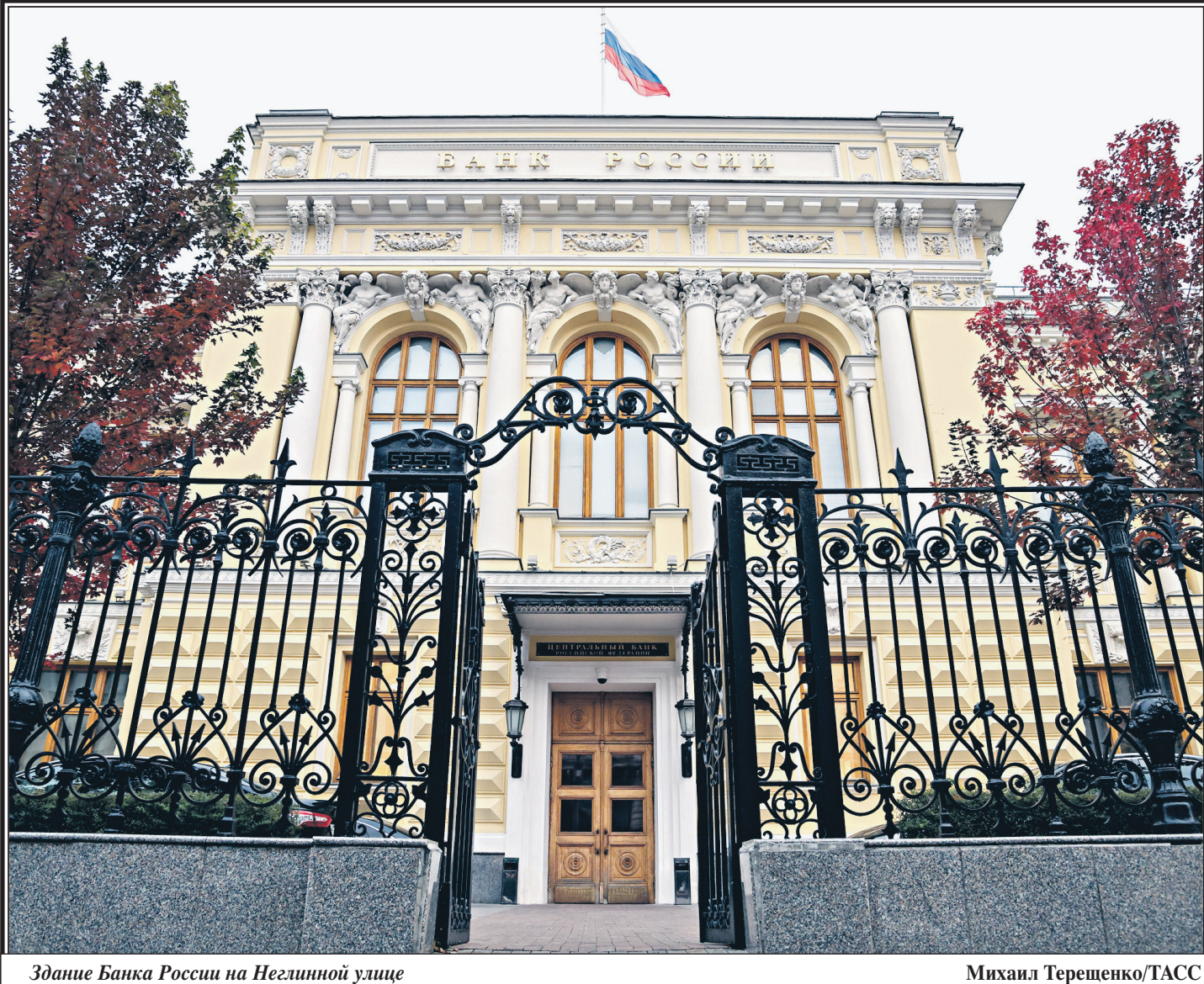
Здание Банка России на Неглинной улице