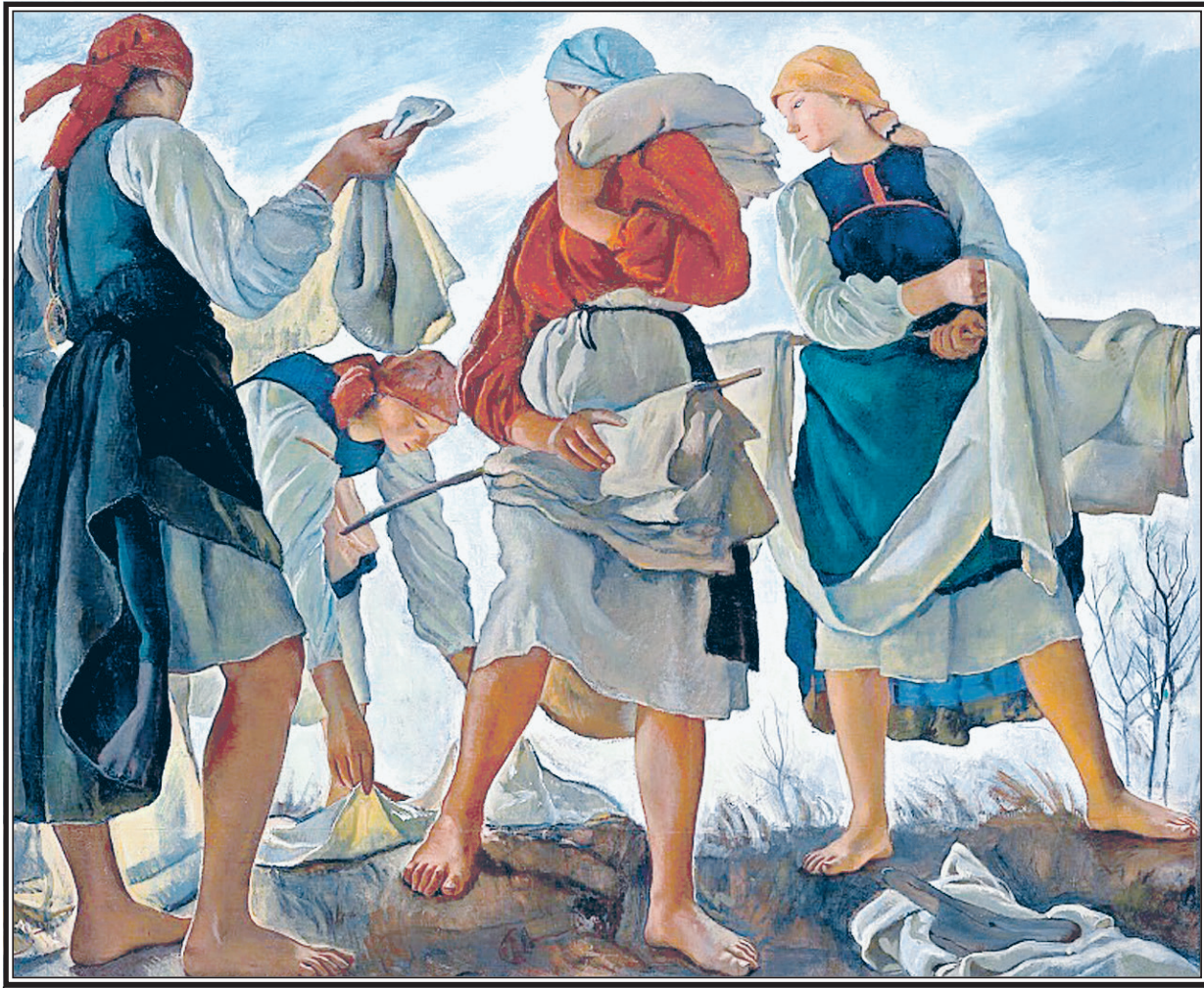
З.Е. Серебрякова. Беление холста (1917)