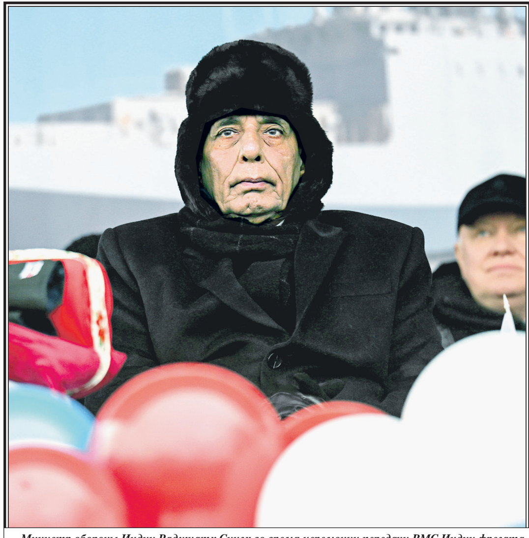
Министр обороны Индии Раджнатх Сингх во время церемонии спуска на воду фрегата Tushil на судостроительном заводе «Янтарь»

Министр обороны Индии Раджнатх Сингх посетил Россию с трехдневным визитом. Министр прибыл в Россию 8 декабря, а 9 декабря в Калининграде принял участие в спуске на воду фрегата проекта 11356 Tushil. Многоцелевой фрегат с управляемыми ракетами-невидимками был построен на заводе Объединенной судостроительной корпорации «Янтарь» для военно-морских сил Индии. Это один из четырех фрегатов, передаваемых Россией Индии. Отмечается, что фрегат способен поражать надводные, наземные, подводные и воздушные цели, хотя обладает довольно небольшим водоизмещением. Изначально корабль строился для Черноморского флота России, однако в 2018 году был заключен контракт с Индией. Он предусматривает строительство двух кораблей в Калининграде и еще двух в Индии на судостроительном заводе Гоа, с использованием российских технологий. Фрегаты будут оснащены различным вооружением, включая российские индийские ракеты BrahMos. 10 декабря Раджнатх Сингх примет участие в 21-м заседании межправительственной комиссии по военному и военно-техническому сотрудничеству в Москве. Там он обсудит с министром обороны России Андреем Белоусовым отношения двух стран в сфере обороны, в том числе военное и промышленное сотрудничество.