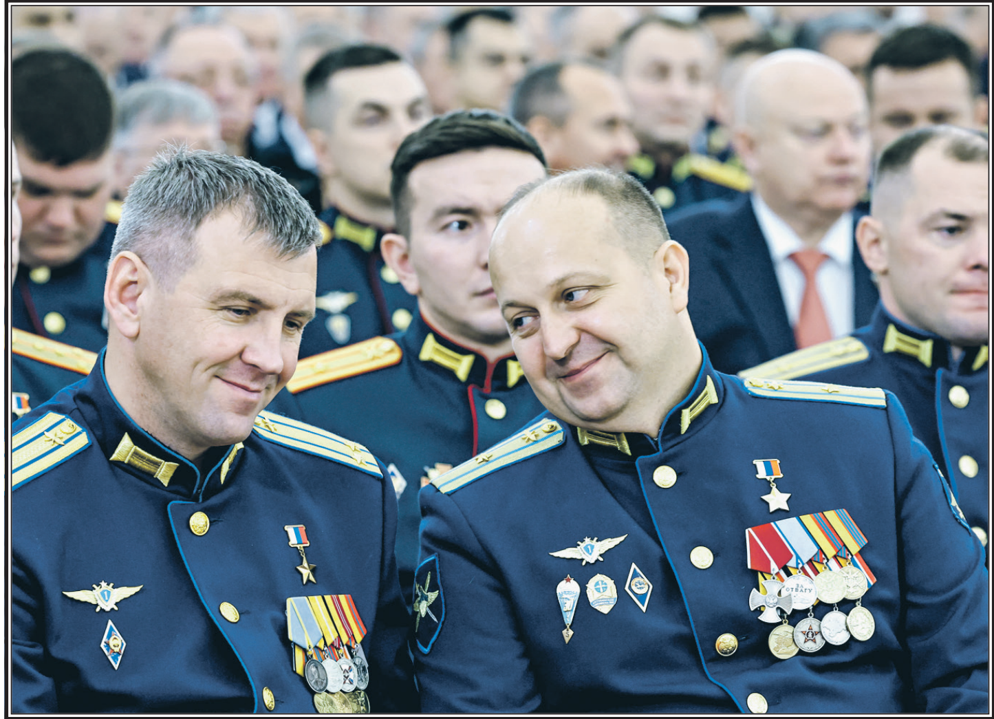
Москва, 9 декабря. Участники торжественной церемонии вручения медалей «Золотая Звезда» Героям России в Георгиевском зале Большого Кремлевского дворца.