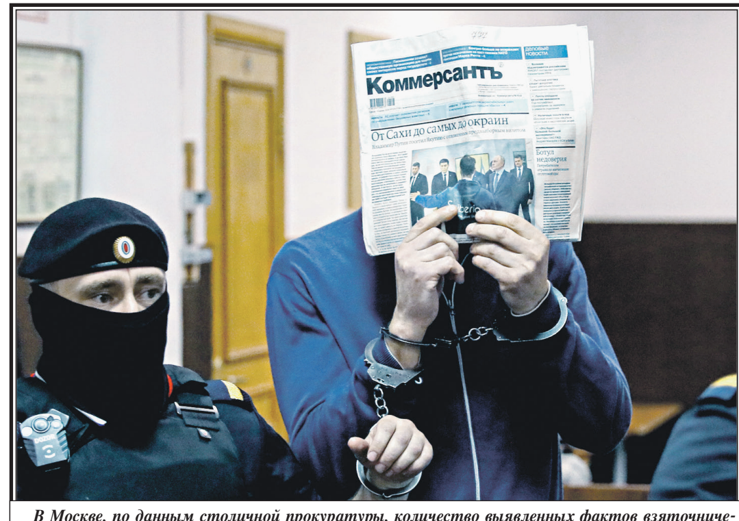
В Москве, по данным столичной прокуратуры, количество выявленных фактов взятничества с начала 2024 года выросло вдвое по сравнению с аналогичным периодом прошлого года. На фото — экс-заместитель министра обороны Тимур Иванов в Басманном суде.