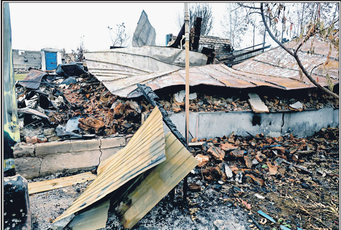
Разрушенные в результате действий ВСУ дома в Беловском районе Курской области.