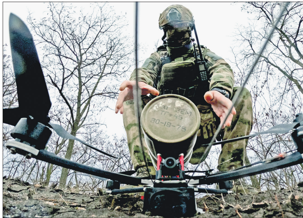
Военнослужащий мотострелкового полка во время работы расчета FPV-дронов в зоне СВО.

Подразделения группировки войск «Центр» продолжили продвижение в глубину обороны противника, нанесли поражение живой силе и технике трех механизированных, двух грехских, мотопехотной, штурмовой бригад ВСУ и бригады морской пехоты в районах населенных