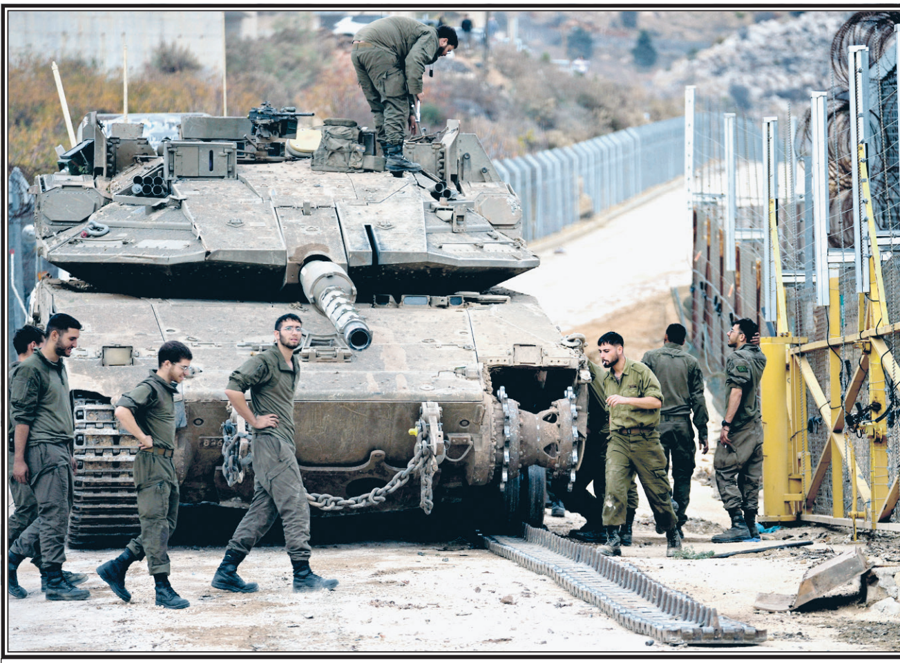
Израильские военные у буферной зоны на границе с Сирией.

«Безусловно, нанесение ударов, действия в районе Голанских высот, в районе буферной зоны вряд ли способствуют стабилизации обстановки и так дестабилизированной Сирии», — прокомментировал ситуацию пресс-секретарь Президента России Дмитрий Песков.