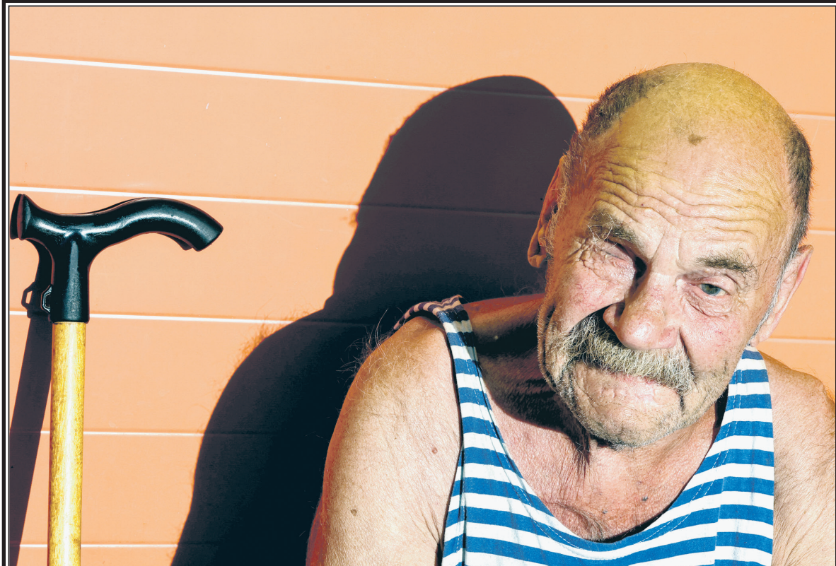
Мужчина в пункте временного размещения для эвакуированных жителей Курской области.