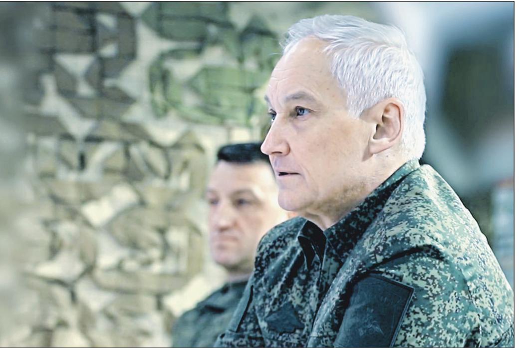
Министр обороны РФ Андрей Белоусов в ходе инспекционной поездки в группировку войск «Восток» заслушивает доклады по характеру действий противника.

Цель удара достигнута. Все объекты поражены.