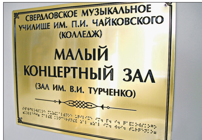
Табличка в честь легендарного директора.