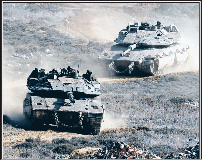
Израильские танки в буферной зоне

Турция имеет продолжительный конфликт с курдами. Курдские организации, несмотря на то, что они также являлись оппозицией, были подвергнуты атакам со стороны протурецких повстанческих группировок уже после смены руководства страны. Как пишет Asharq Al-Awsat, у Турции даже имеются договоренности с США по поводу курдских регионов Сирии. Не зря после того, как вооруженная оппозиция захватила Дэйр-эз-Зор и Манбидж, бои прекратились из-за «неких заключенных соглашений».