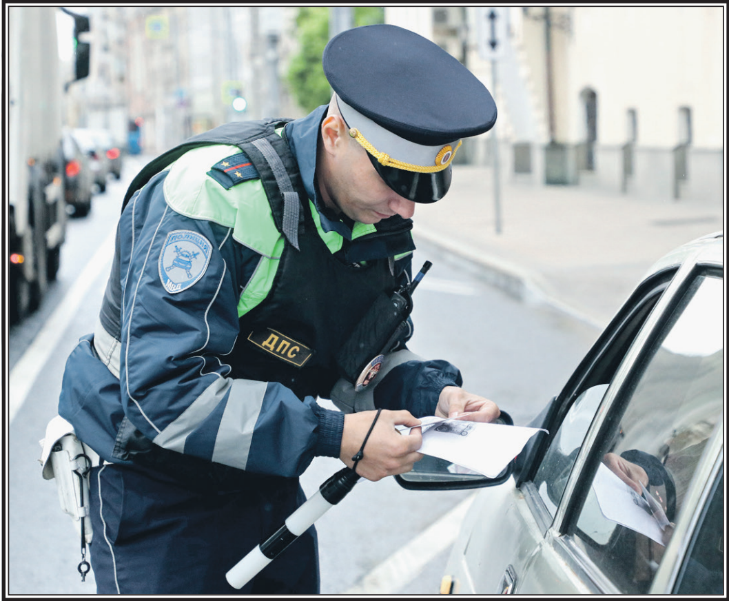
Инспектор ДПС ГИБДД во время проверки документов.

будут значимой прибавкой к бюджету. А возможно, там и вторая причина – избежать гласности, сделать так, чтобы народ не обсуждал статьи Кодекса об административных правонарушениях... Напомню, что Конституционный Суд в своем постановлении еще в 2001 году прямо указал: искажение изначального волеизъявления в законодательной практике свиде-