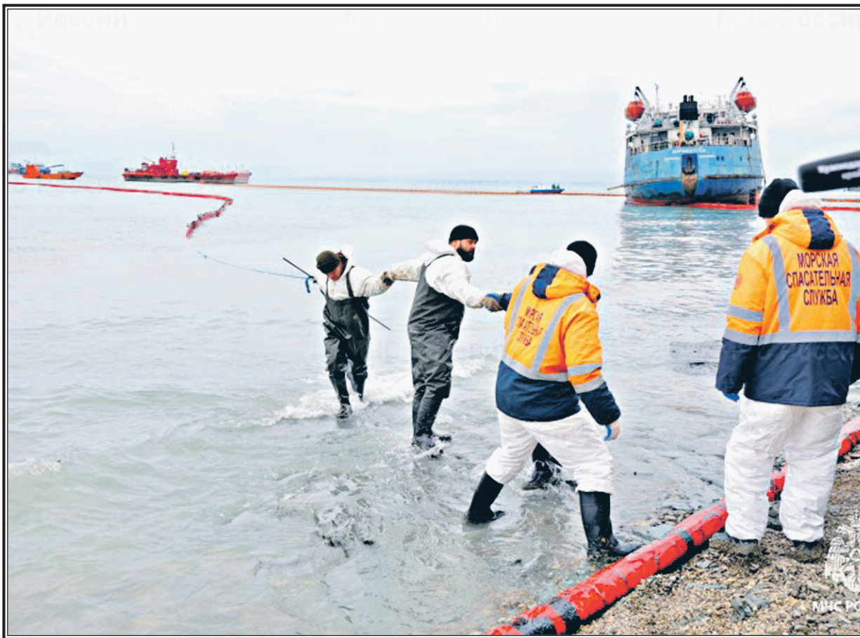
Кадр из эфира Первого канала

В прошлом номере наша газета писала о крайне сложной экологической ситуации, которая складывается в настоящее время вблизи порта Тамань. Разлив в море нефтепродуктов грозит большой бедой.