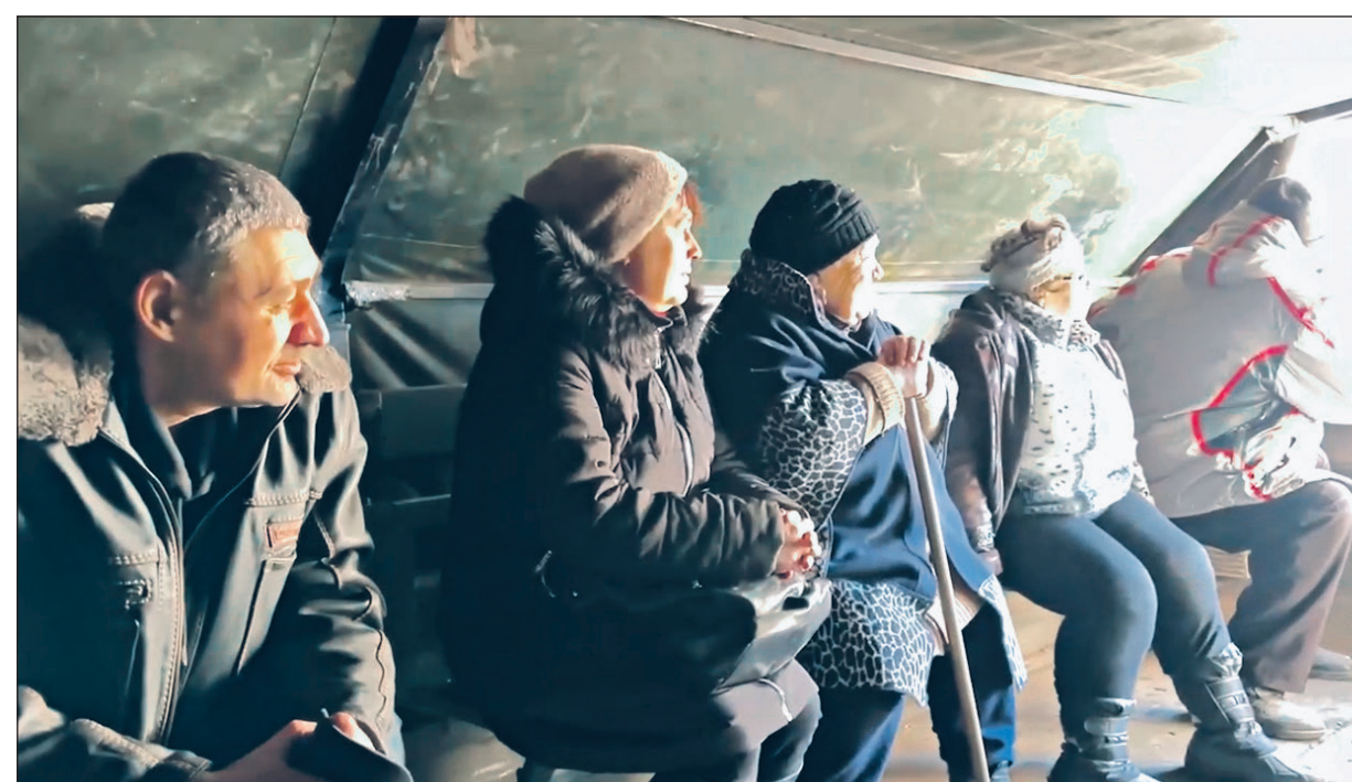
Эвакуированные жители Курахово.

Военнослужащие Южной группировки войск продолжают работу по оказанию помощи и эвакуации местного населения из Курахово и других освобожденных от украинских националистов населенных пунктов Донецкой Народной Республики.