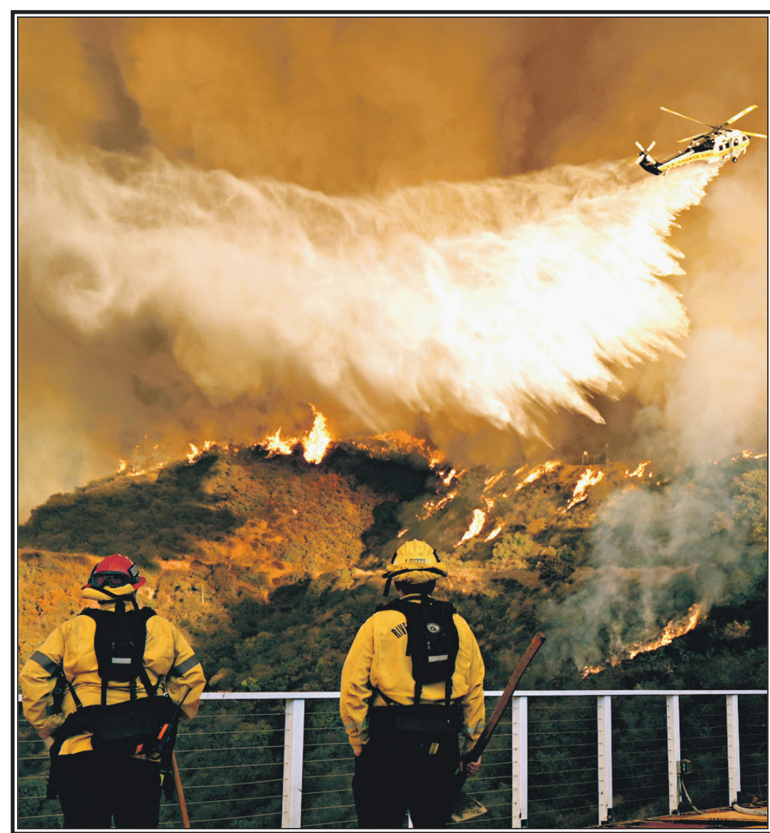
Тушение лесных пожаров в Калифорнии.

Между тем, по данным американских властей, более 24 000 человек уже зарегистрировались для получения федеральной помощи.