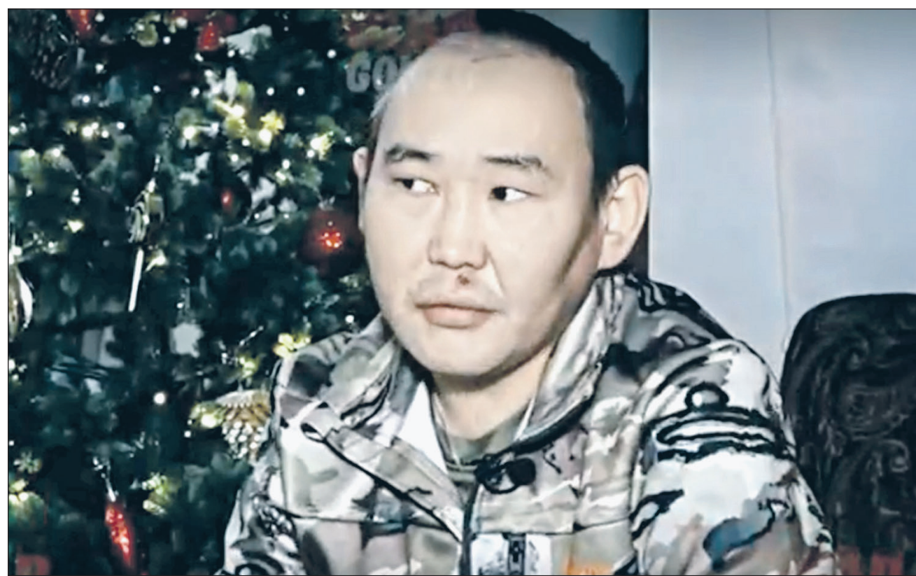
Кадр из эфира канала «Россия-24»

«Меня ударил этот FPV-шник, рана в области шеи [на щеке], здесь [у глаза], в ухо было. Он подбежал и со мной начал разговари-