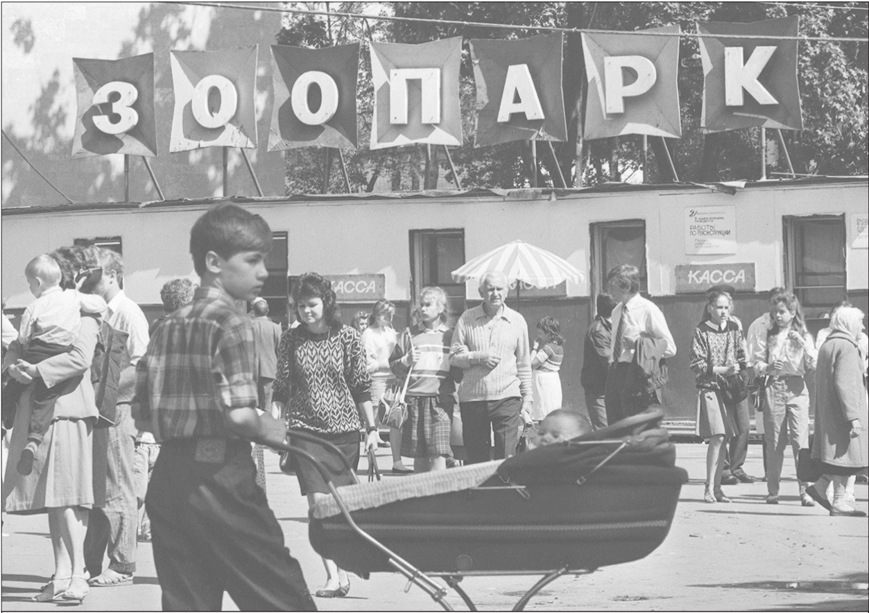
У входа в Ленинградский зоопарк.

Мелкие хищники, которые не брезгуют растительной пищей, с аппетитом ели фарш из корнеплодов, отрубей, жмыха. Те, кто привик охотиться и есть исключительно мясо (совы, уссурийский тигр, орел), от такой ели отказывались, почему работники зоопарка пошли тогда на хитрость: растительный фарш зашивали в шкурки «добычи» – кроликов или морских свинок. Хищники разрывали жертву и с удовольствием ели заменитель