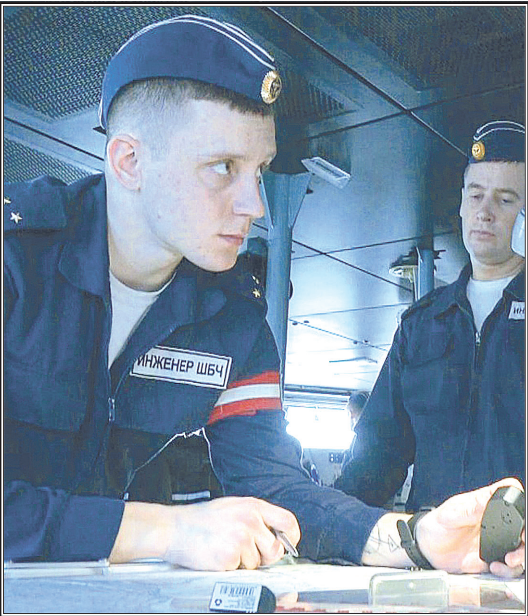
Отряд кораблей Тихоокеанского флота в составе корветов «Резкий», «Герой Российской Федерации Аладар Цыденжапов» и среднего морского танкера «Печенга» продолжает плановое выполнение поставленных задач в Азиатско-Тихоокеанском регионе.

В том числе в ходе отражения контрнаступления в направлении населенных пунктов Черкаска Конопелька и Уланок противник потерял более 200 человек. Уничтожены восемь танков, пять боевых машин пехоты, бронетранспортер и 30 боевых бронированных машин, а также три инженерные машины разграждения, мостоукладчик и другая техника.