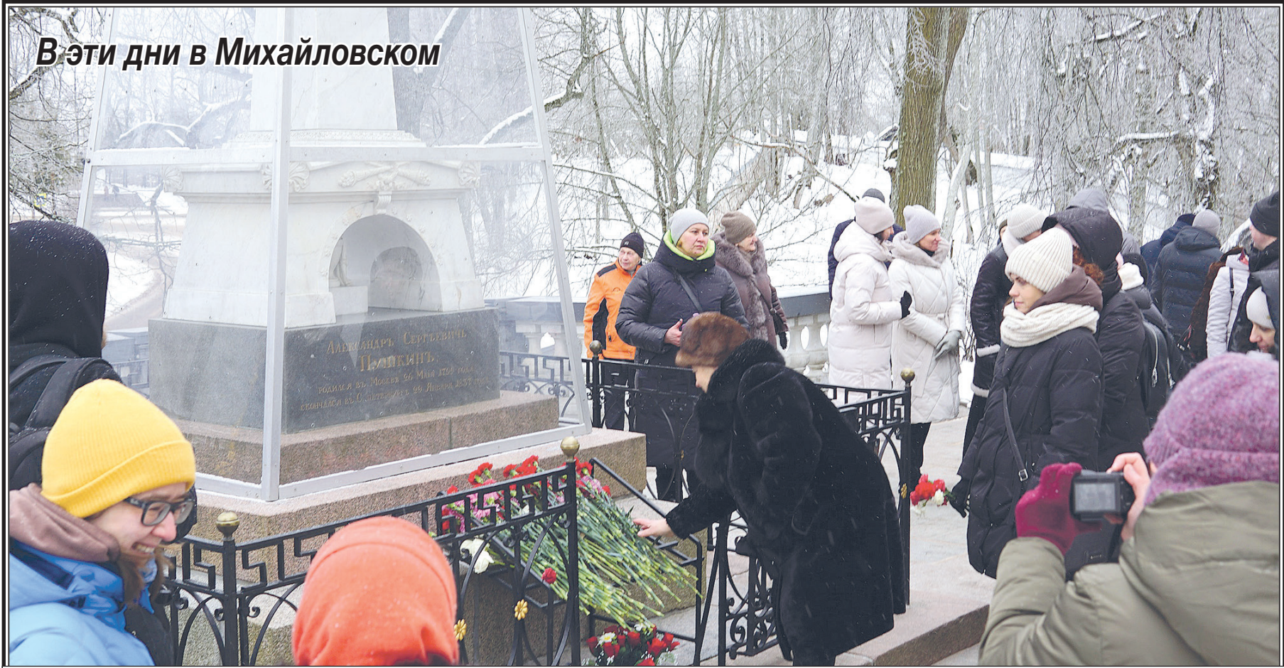
10 февраля 2025 г. Возложение цветов к могиле великого поэта.

В ведомстве добавили, что суд удовлетворил гражданский иск представителя потерпевшего в полном объеме. Осужденный взят под стражу в зале суда.