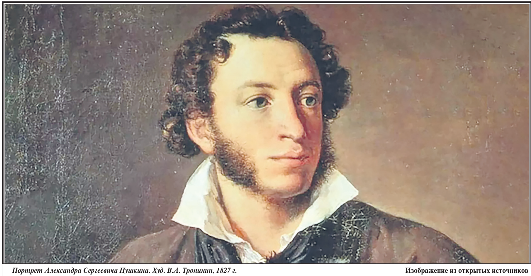
Портрет Александра Сергеевича Пушкина. Худ. В.А. Тропинин, 1827 г.

«И далеко буду тем любезен я народу, Что чувства добрые я лирой пробуждал...»