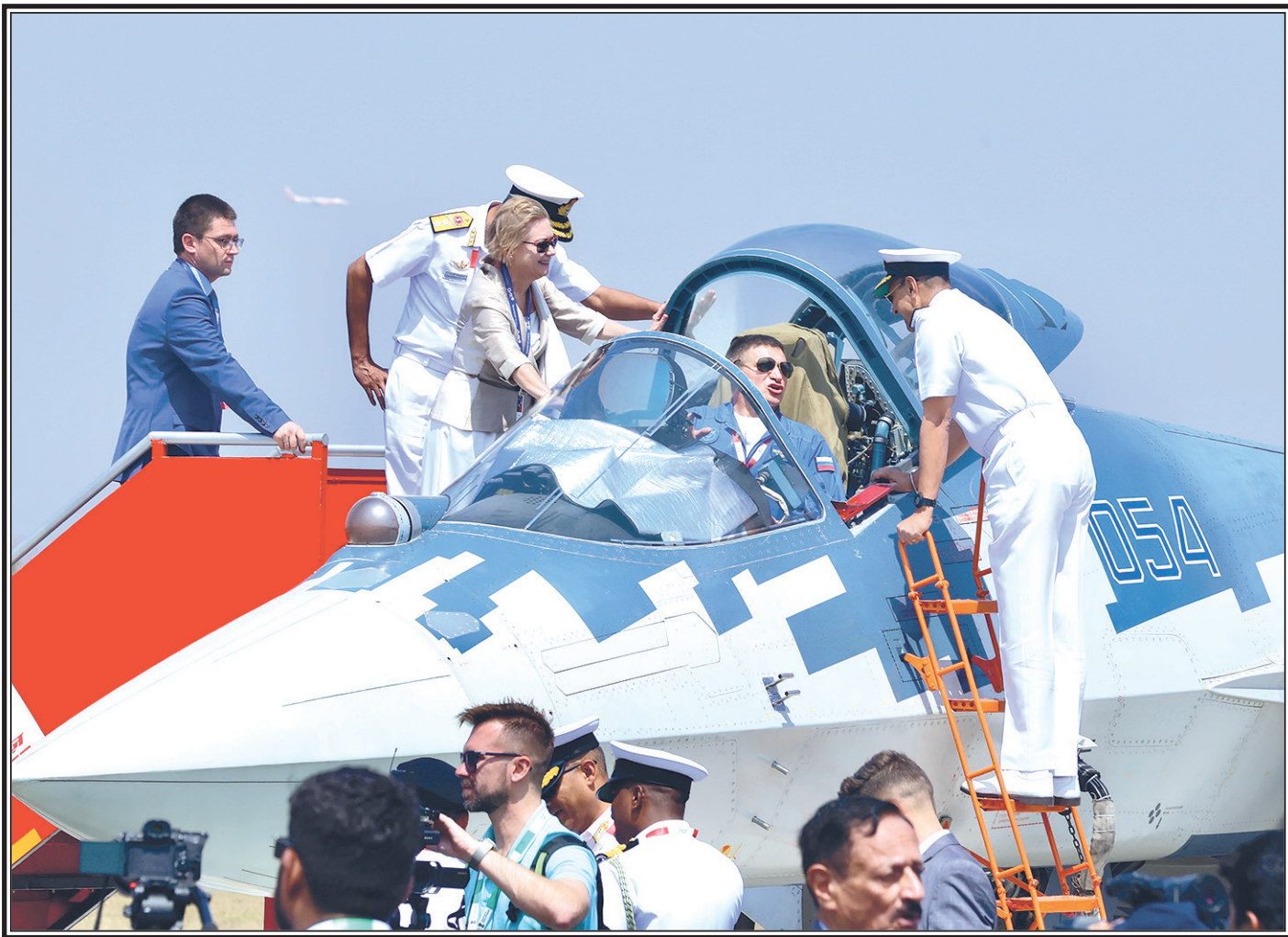
Российский многоцелевой истребитель пятого поколения Су-57 на международной аэрокосмической выставке Aero India 2025.