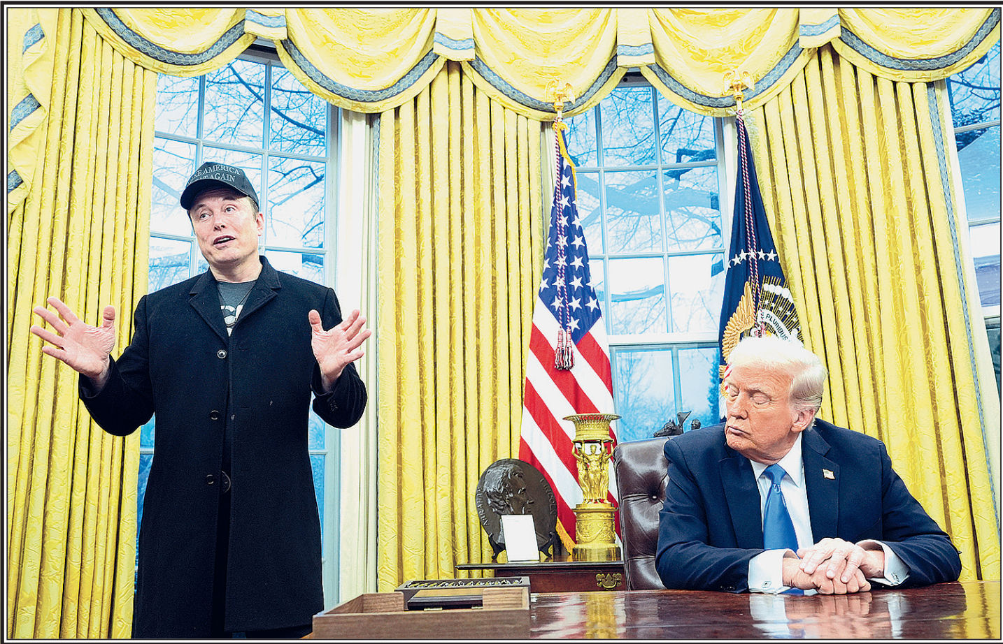
Дональд Трамп и Илон Маск во время встречи в Овальном кабинете Белого дома.

Дискуссии прошли в содержательном и деловом ключе. Условлено продолжать диалог по данному каналу.