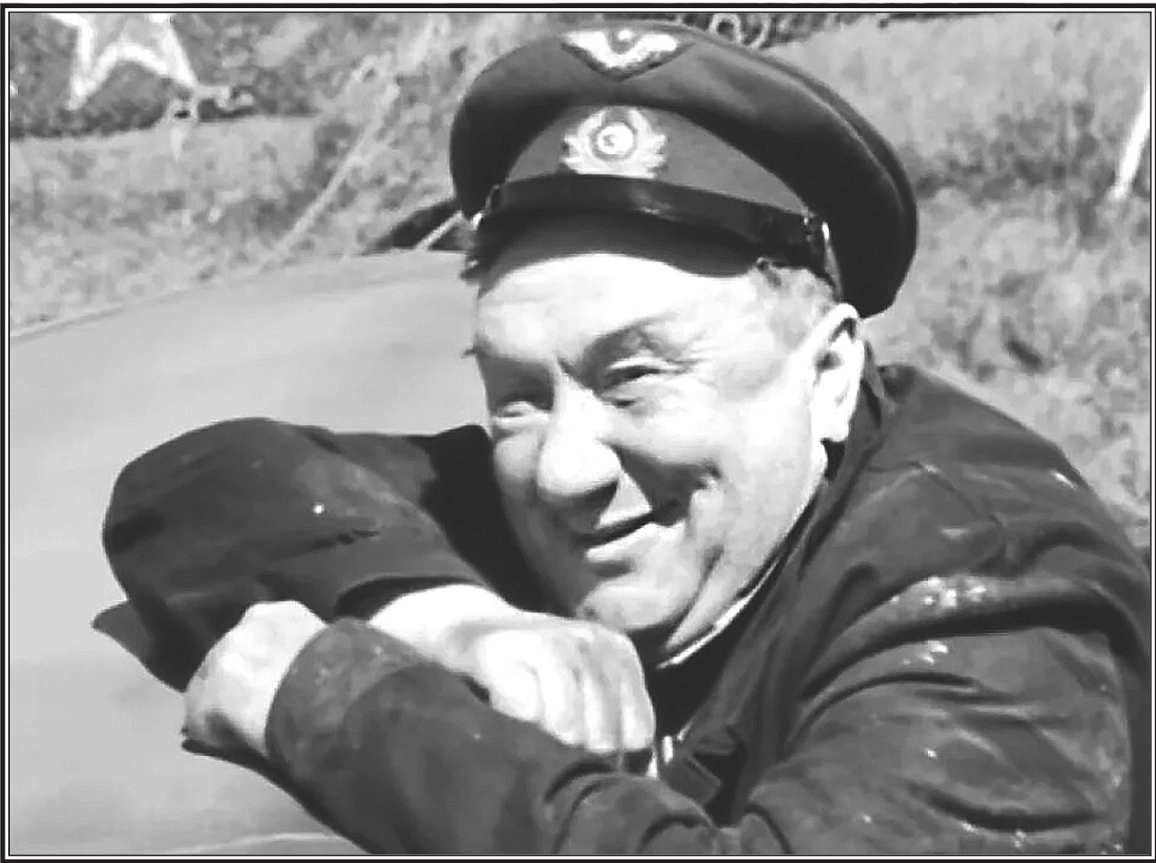
Кадр из фильма «В бой идут одни «старики».