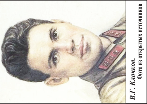
В.Г. Ключков.