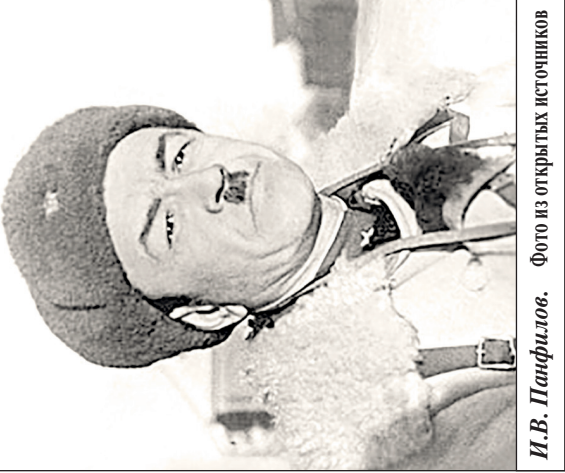
И.В. Панфилов.

провели необычайную стойкость и силу духа, хотя враг и обледал колоссальным численным превосходством. Но и в самые трудные дни радости несли, что противник нес огромные потери в живой силе и технике, группа немецких армей «Центр», наступавшая на Москву, обладала к 16 сентября 1941 г. огромным превосходством перед нашими войсками в людях, танках, самолетах... Дело в том, что только в декабре 1941 г. у нас перестало падать производство боевой техники и вооружения. Падение производства вызвала потеря крупных промышленных районов. Нужно было время, чтобы наши демонтированные предприятия, двигавшиеся в эшелонах на востоке, разместились на новых местах и начали выпускать продукцию. А танки врага рвались вперед. И только в середине второг полугодия 1941 г. у нас было восстановлено производство 45-миллиметровых и начальных 57-миллиметровых противотанковых пушек. В октябре 1941 года наша промышленность начала давать фронту противотанковые ружья. Но до поры наша армия не смогла отвечать на удар врага немедленными мощными контрударами, что было необходимо. А легендарный генерал вскоре после начала войны пришел к мысли, что пехота – раз уж того требовалась на многих участках фронта – не только должна, но и может один на один выстоять против танков врага – особенно при полной поддержке артиллерии и самолетов, что в ходе боя и подтвердилось. Поскольку боевые действия всегда проходили в сложной обстановке – со многими неизвест-