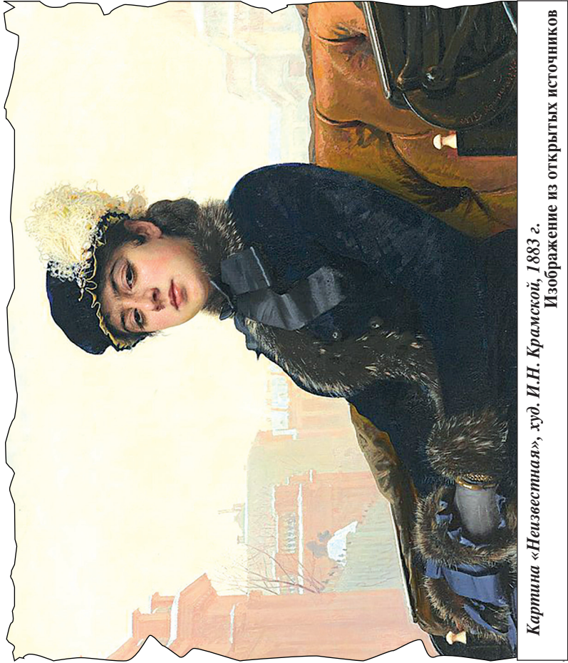
Картина «Неизвестная», худ. И.И. Крамской, 1883 г.