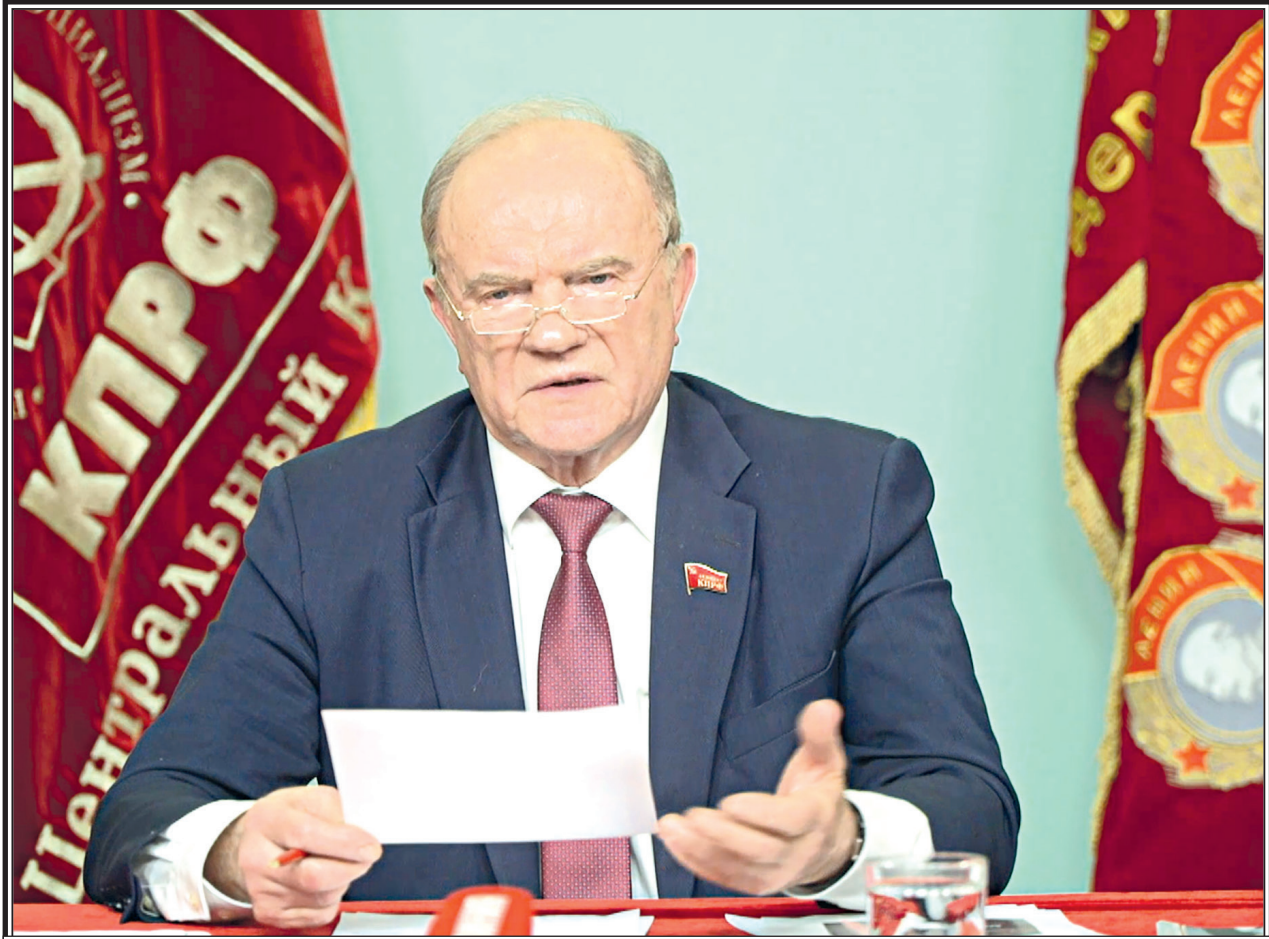
Кадр из эфира телеканала «Красная линия»