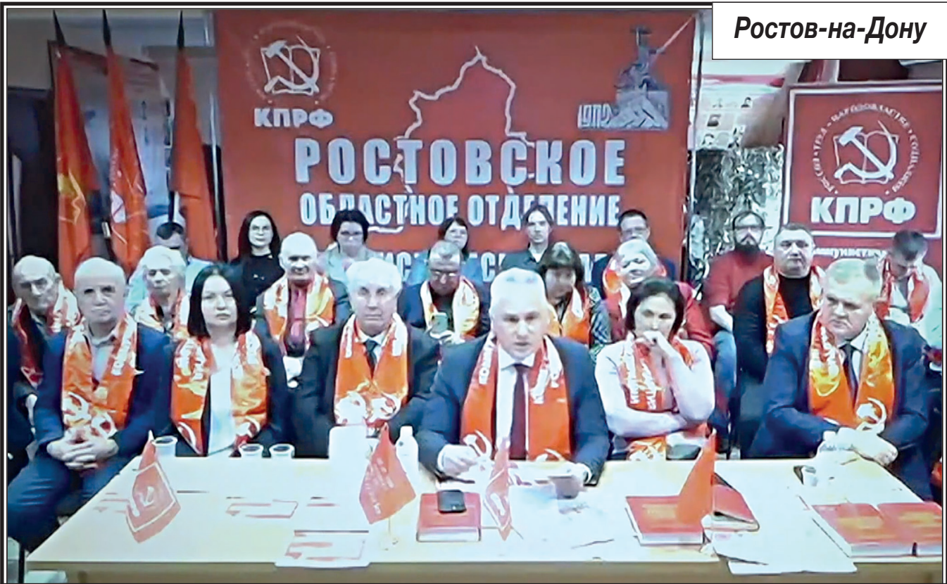
Кадр из эфира телеканала «Красная линия»

В этой связи – двенадцатый тезис . Особое внимание – новейшим технологиям и выходу на мировые темпы развития ключевых отраслей науки. Хотел бы от имени нашего собрания обратиться к правительству Мишустина. Почему? Потому что впереди отчет правительства. На это правительство взыались большие трудности. И ковид, и три года войны, и 25 тысяч санкций, и многое другое. Оно работает лучше, энергичнее, содержательнее. Более тесно взаимодействует с Думой и мы все это ощу-