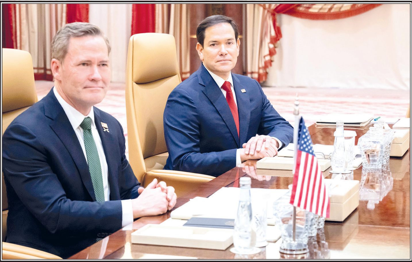
Джидда (Саудовская Аравия). Советник по национальной безопасности США Майк Уолтц и госсекретарь США Марко Рубио перед началом переговоров с делегацией Украины.

БРЮССЕЛЬ. Европарламент принял проект резолюции с призывом организовать «массштабную линию обороны» на границе с Россией и Белорусией. Авторы документа назвали Россию «самой существенной прямой и непрямой угрозой» для безопасности Евросоюза и стран – кандидатов на вступление в ЕС.