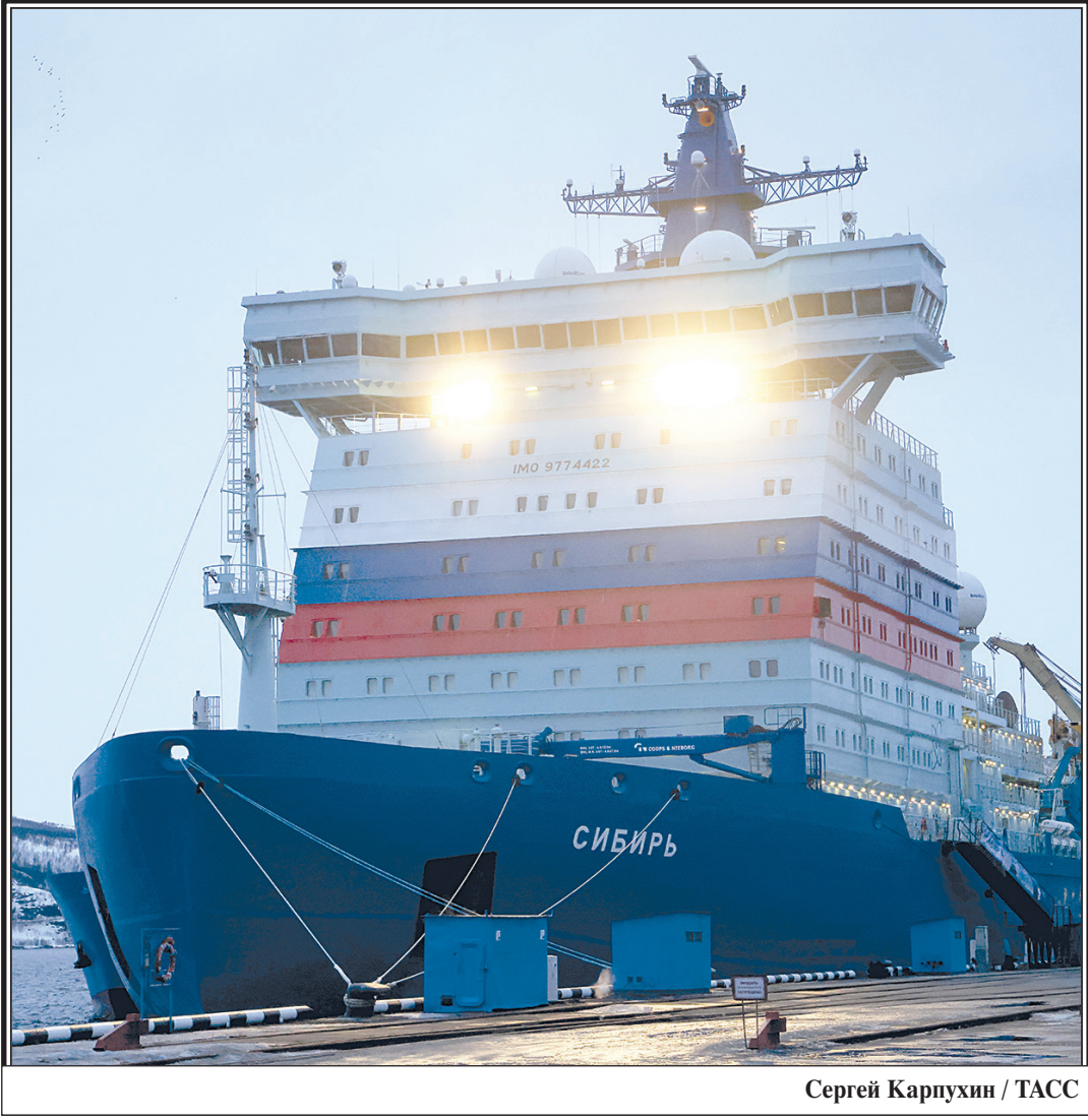
Сергей Карпунин / ТАСС

Главной причиной потерь населения стало резкое обнищание в 90-е годы. Нести сверхтраты на выживание северянам не позволяли низкие доходы. После приватизации загибались построенные в СССР предприятия, да и планового распределения на них уже не было. Примером является кризис угольной добычи в Коми. Без должного финансирования социалка опорников ветшала, и каркас жизнедеятельности рассыпался.