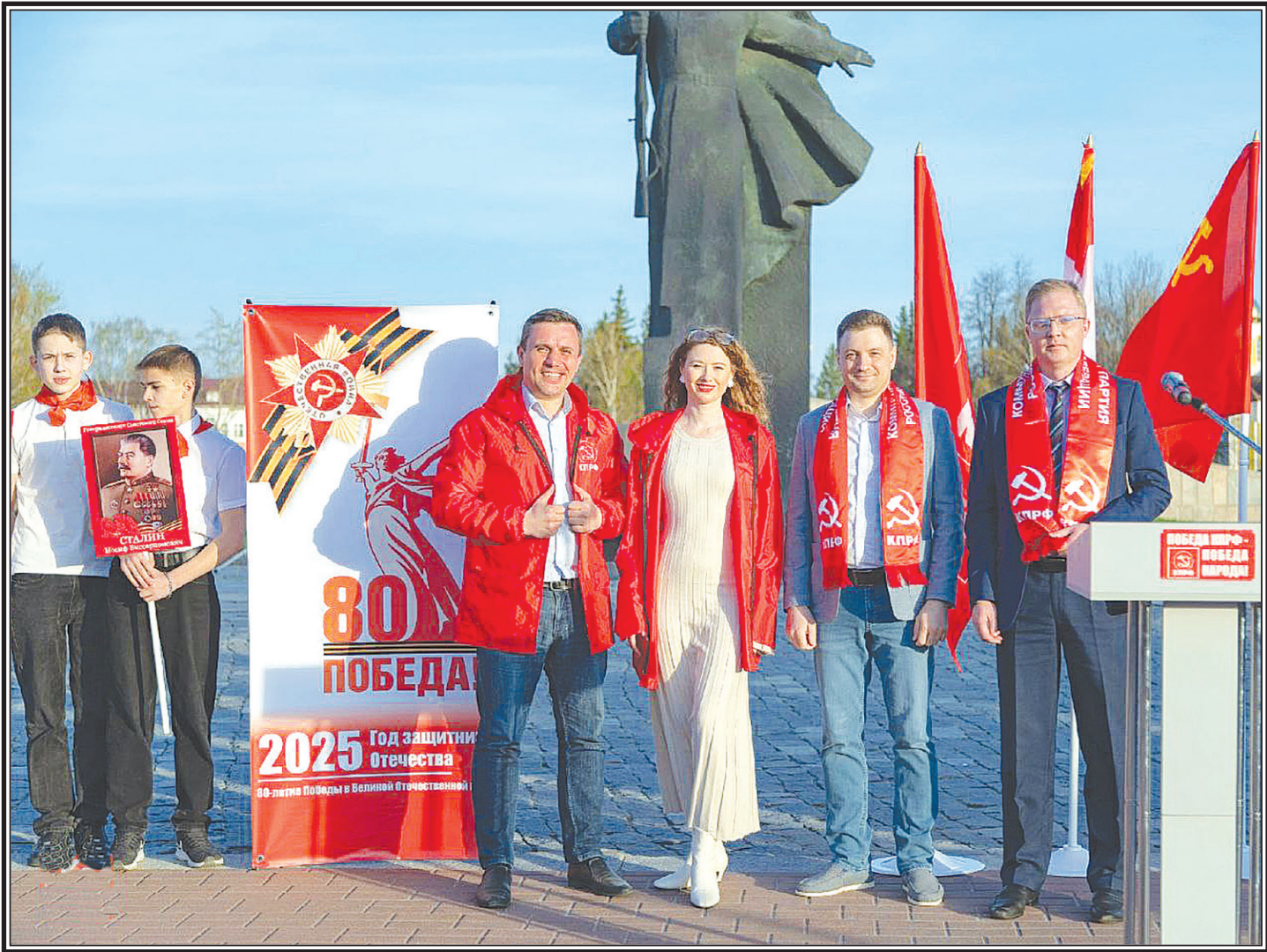
Пресс-служба Пензенского обкома КПРФ

Никто не забыт, ничто не забыто! КПРФ – за правду, справедливость и Великую Победу!