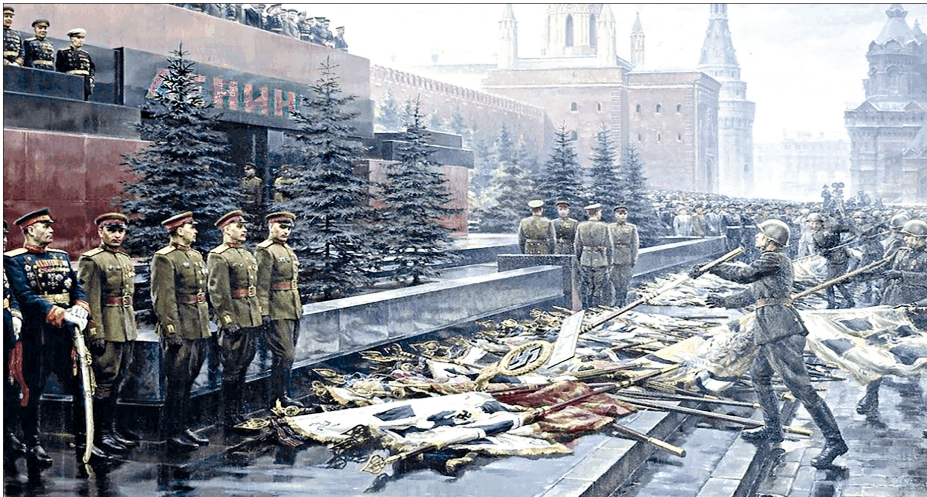
Михаил Хмелько. «Триумф победившей Родины», 1949 г.

Читайте на 4-й странице «Рулевой планеты»