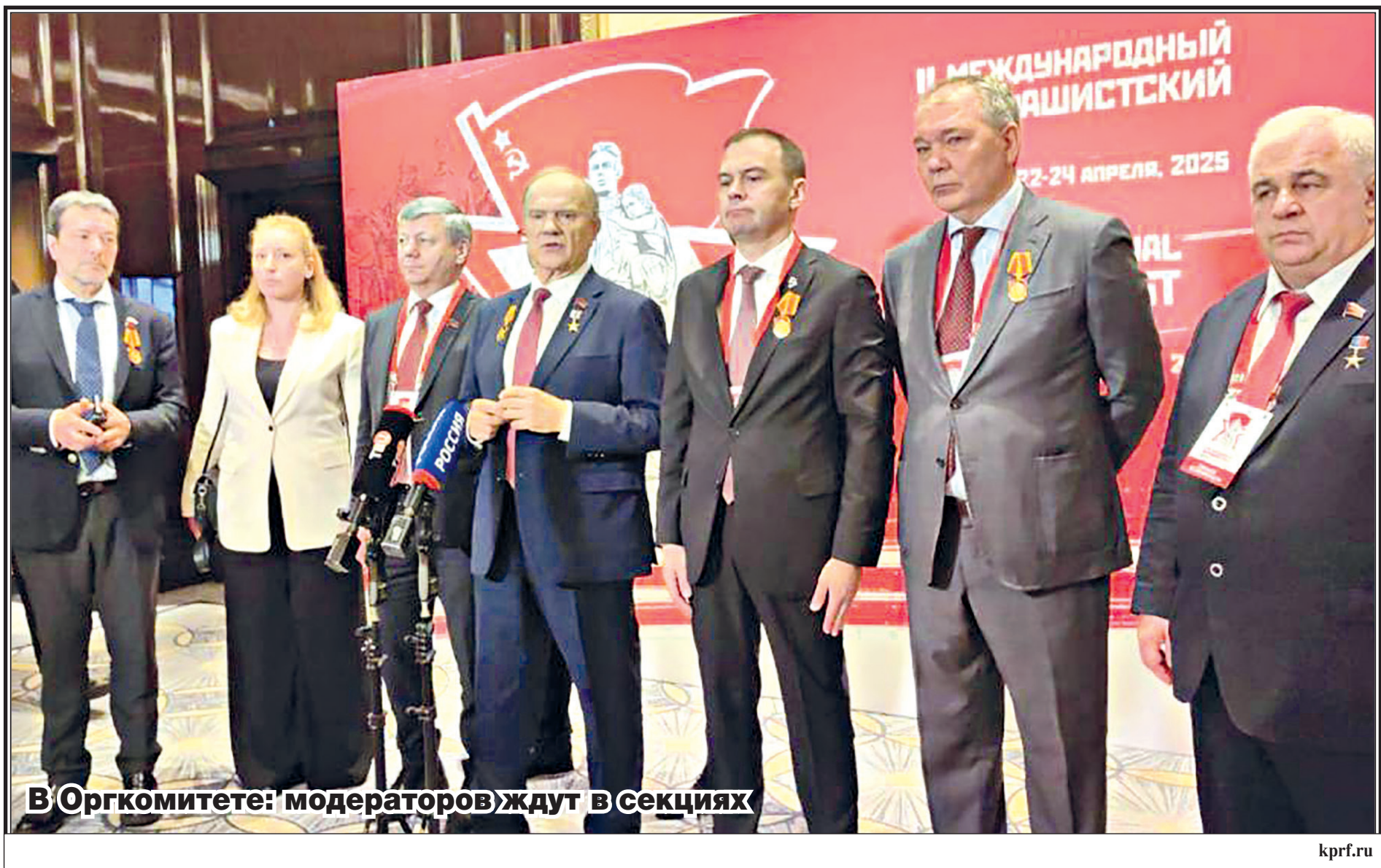
В Оргкомитете: модераторов ждут в секциях