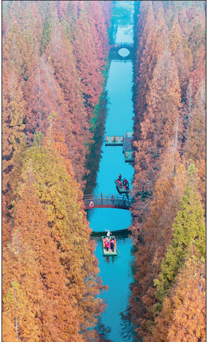
Национальный лесной парк в китайской провинции Цзянсу.

Новое исследование показало, что в Китае насчитывается около 142,6 миллиарда деревьев. Это примерно 100 деревьев на одного жителя, 689 деревьев на гектар. Данные впечатляют, особенно учитывая плотность населения страны. Точная оценка численности деревьев в Китае важна для оценки состояния лесных экосистем и объ-