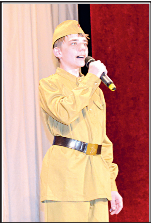
Воронежский обком КПРФ