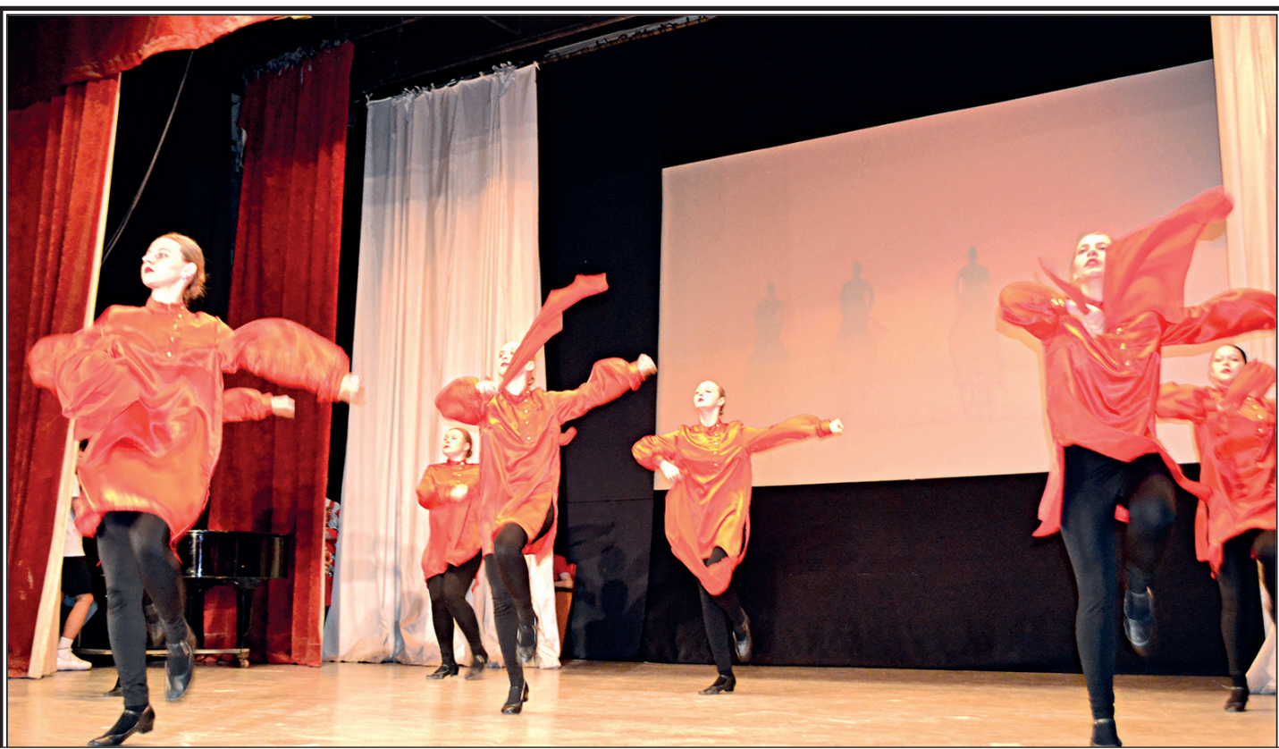
Воронежский обком КПРФ