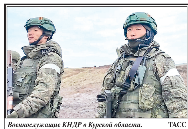
Военнослужащие КНДР в Курской области.