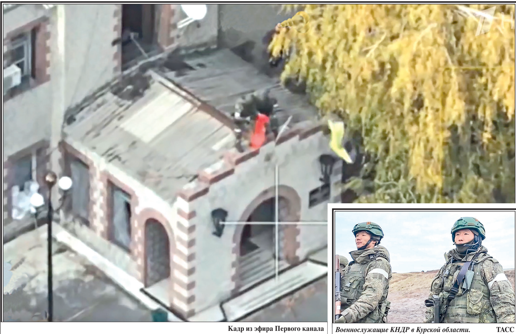
Кадр из эфира Первого канала