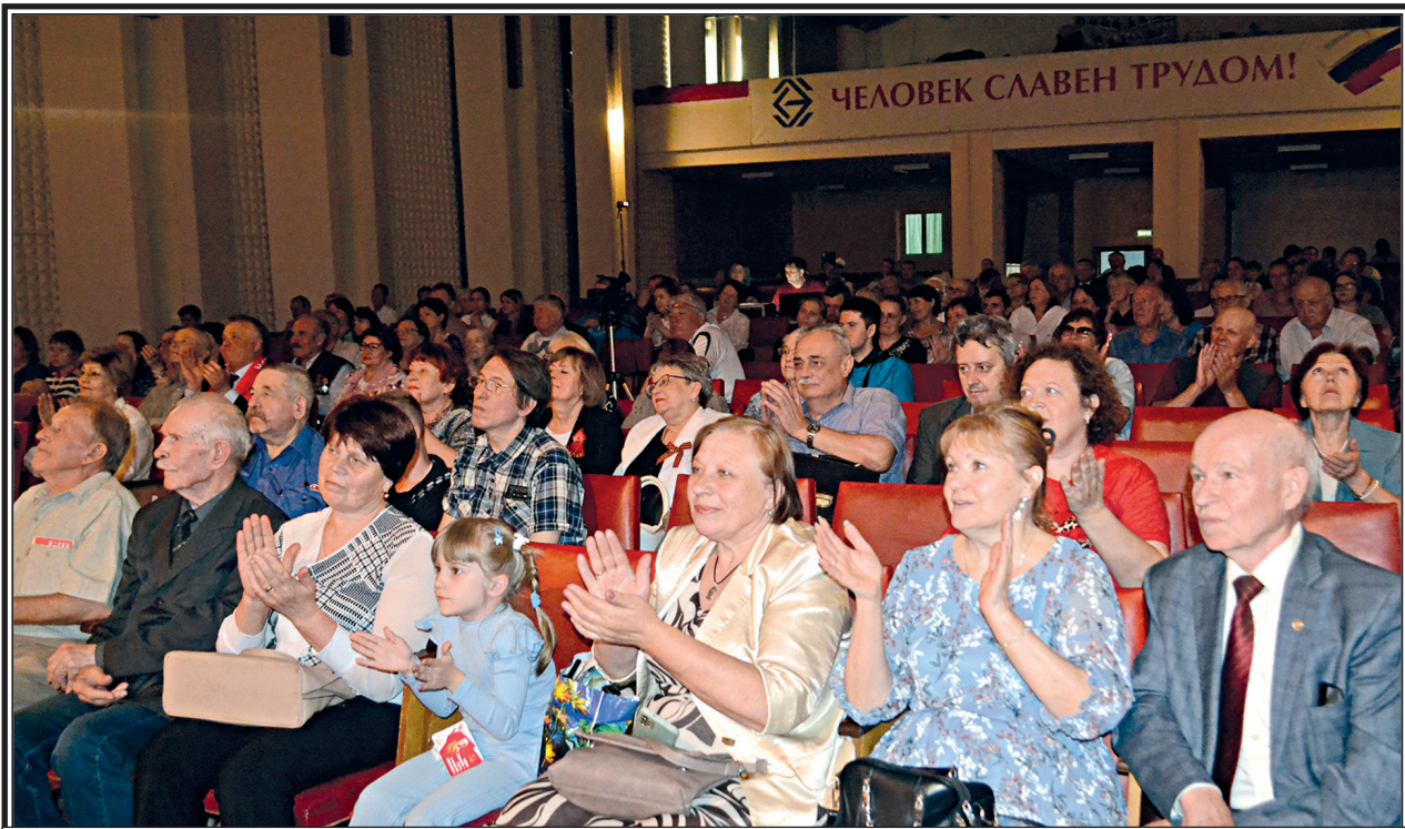
Воронежский обком КПРФ