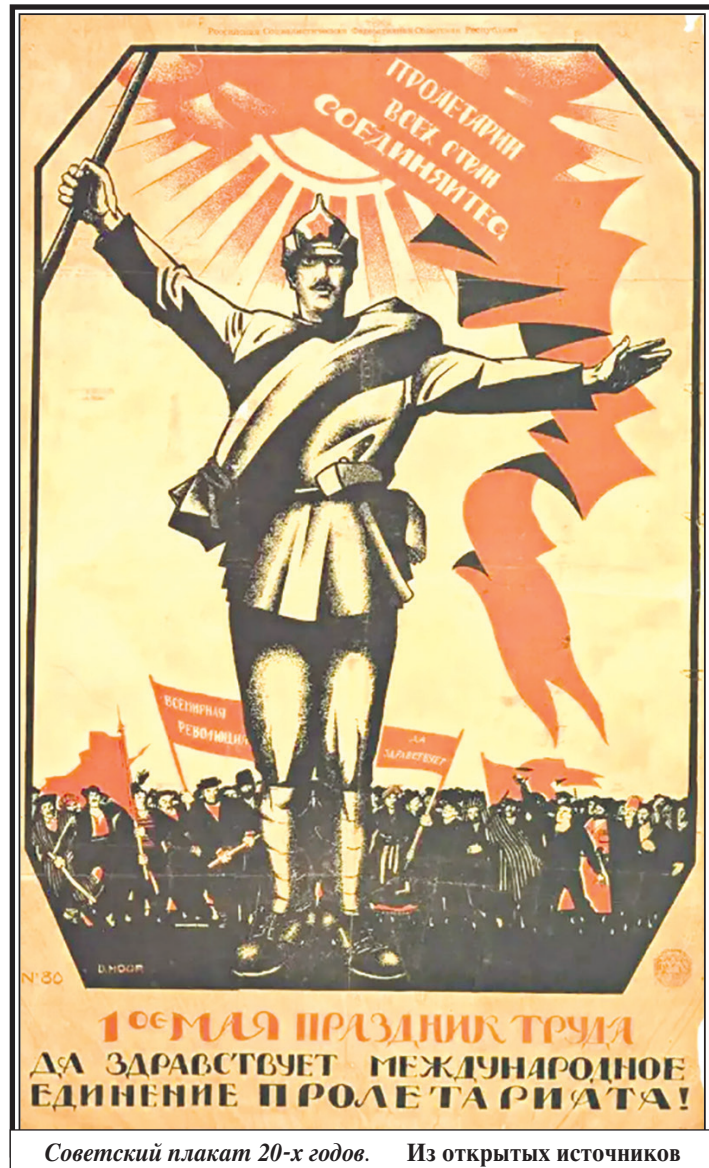
Советский плакат 20-х годов.