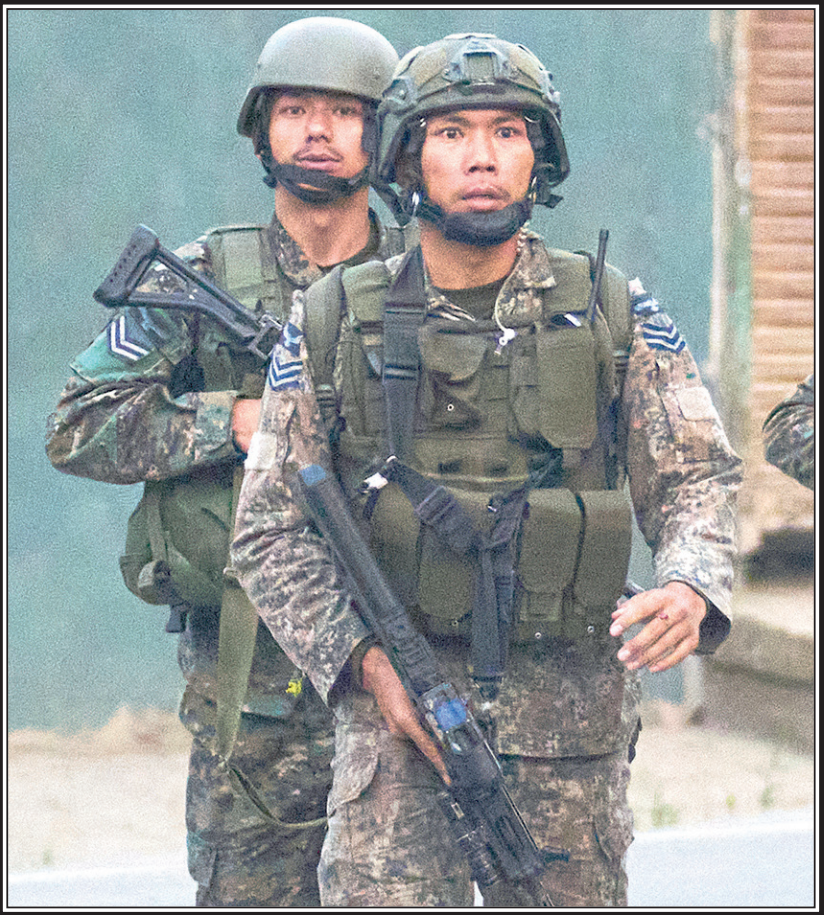
Индийские военнослужащие в ходе операции «Синдур».