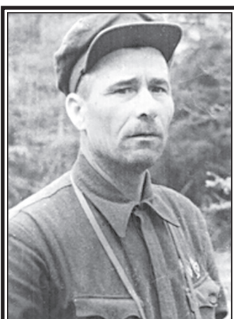
Минай Филиппович Шмырев, организатор партизанского движения в Витебской области, Герой Советского Союза.

Сегодня в номере «Советской России» читайте наше приложение к газете «ОТЕЧЕСТВЕННЫЕ ЗАПИСКИ»