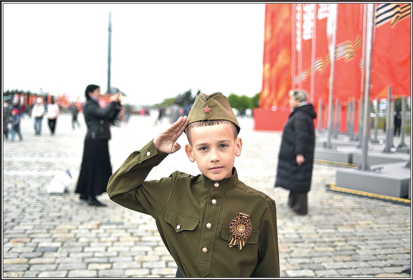
9 мая 2025 года. Москва. Поклонная гора.