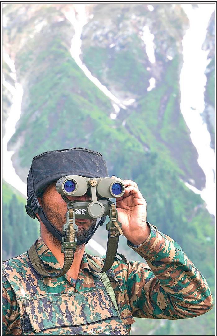
Индийский солдат в Кашмире.