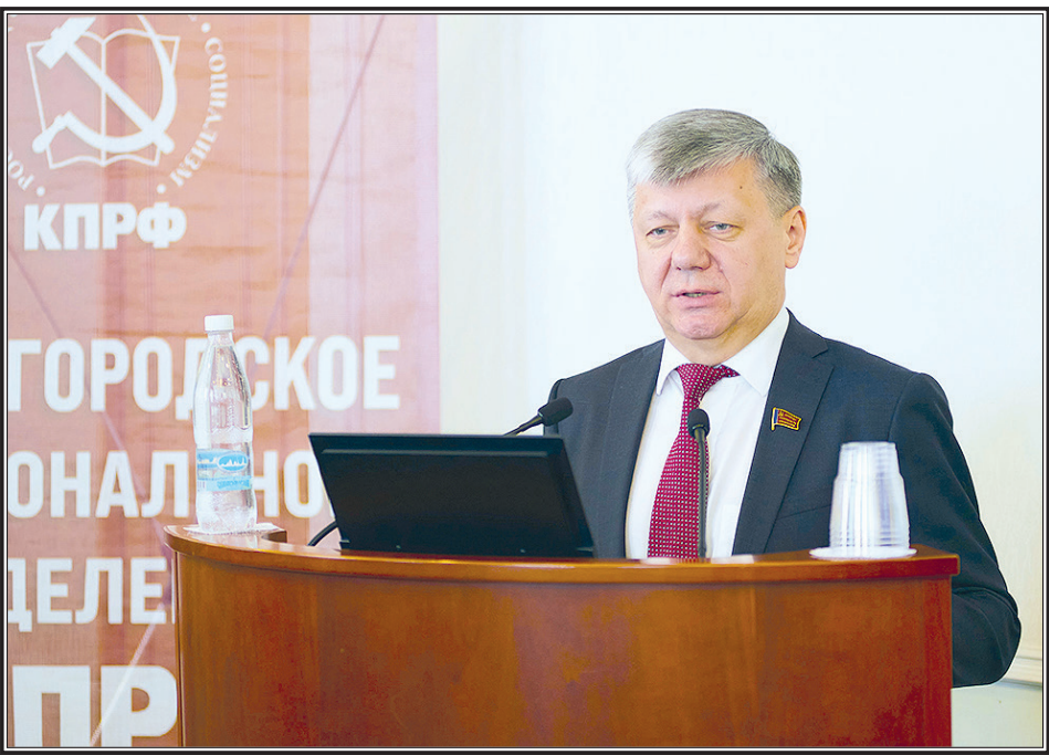
Пресс-служба ЦК КПРФ

В Нижнем Новгороде под эгидой КПРФ состоялась ряд значимых мероприятий, приуроченных к столетию начала индустриализации в СССР. Среди них – встречи народных избранников с гражданами, посещения пунктов для голосования, общение с представителями средств массовой информации, организаторами проводимого КПРФ Народного референдума, а также живой диалог со студентами ведущих вузов региона и коллективный визит в будущий «Сталин-центр», который создается на Нижегородской земле по инициативе коммунистов.