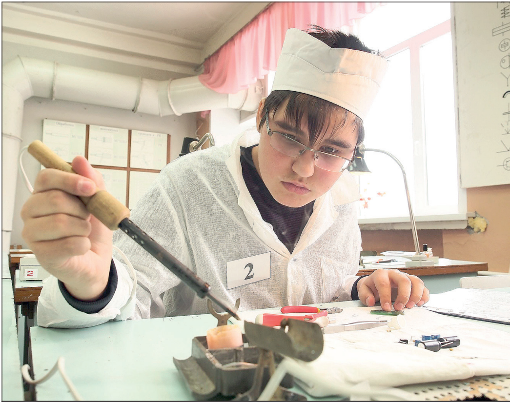
Учащиеся тульского машиностроительного колледжа им. Никиты Демидова на соревнованиях по профмастерству.