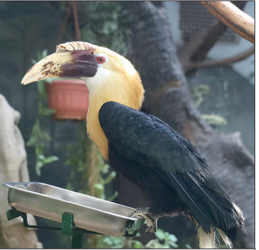
ТГ-канал «Московский зоопарк», t.me/Moscowzoo_official

Более 201 тыс. человек присоединились к онлайн-голосованию на платформе «Активный гражданин», где выбирали имя для нового обитателя Московского зоопарка – птенца па-