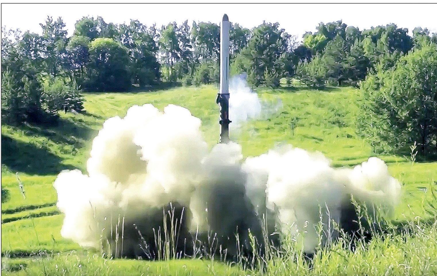
Боевая работа ОТРК «Искандер» в ходе СВО.