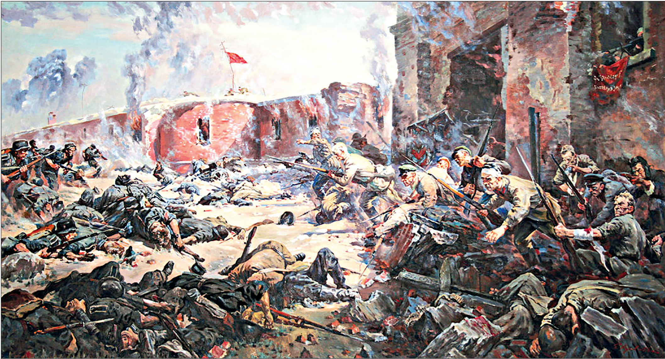
«Защитники Брестской крепости», худ. П.А. Кривоногов, 1951 год