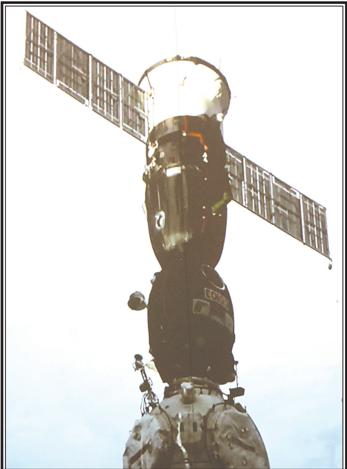
Стыковка корабля «Союз МС-27» с МКС.

20 ноября 1998 года ракета-носитель «Протон-K» вывела на орбиту первый модуль МКС – созданный в России функционально-грузовой блок «Заря» массой около 20 тонн.