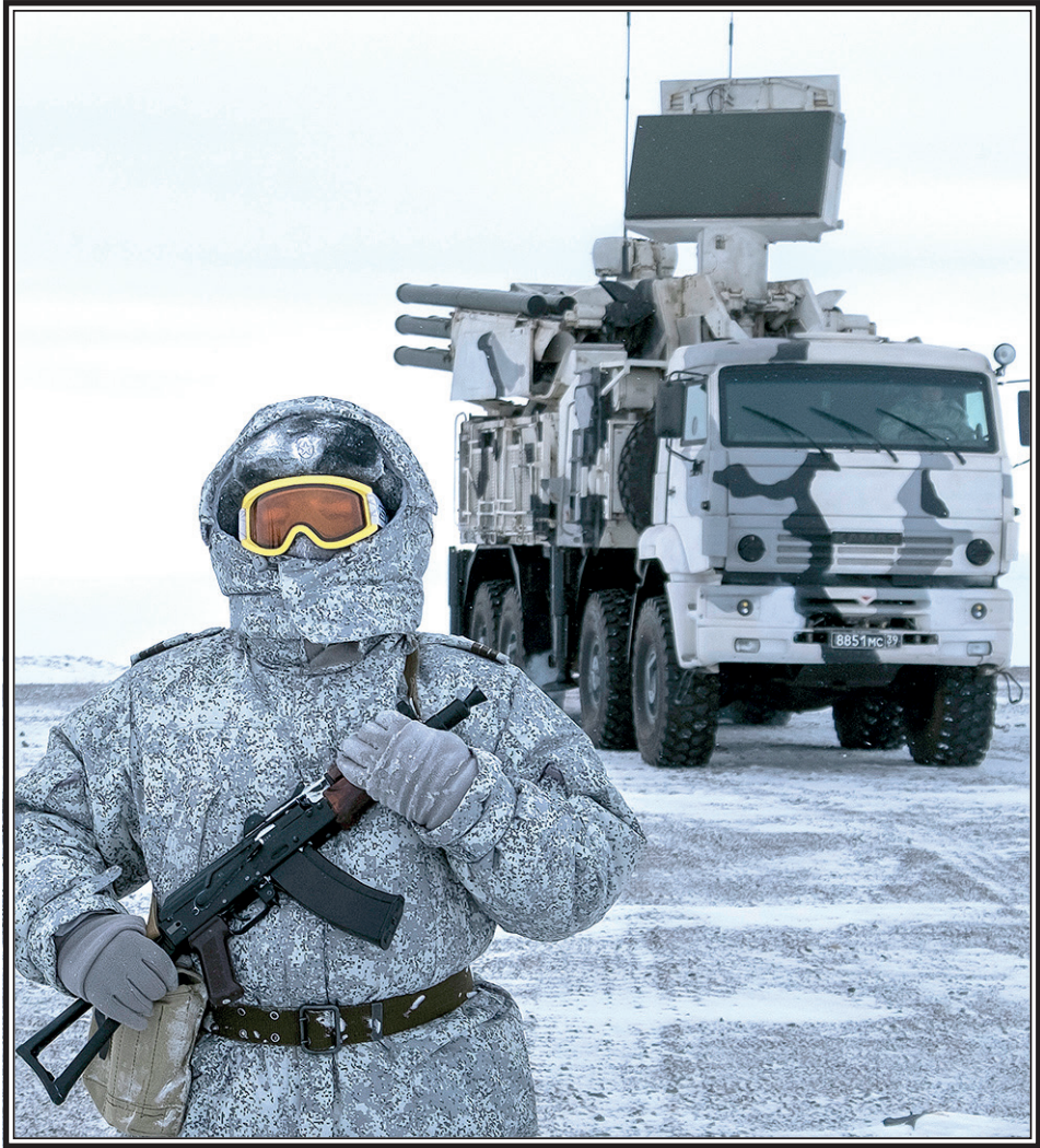
На российской базе «Северный клеввер» в Арктике.