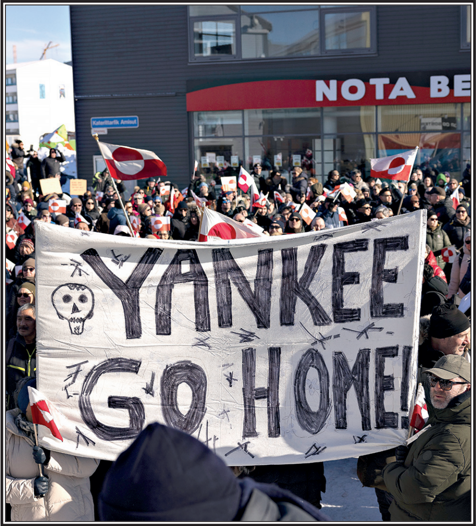
Акция протеста перед консульством США в Гренландии.