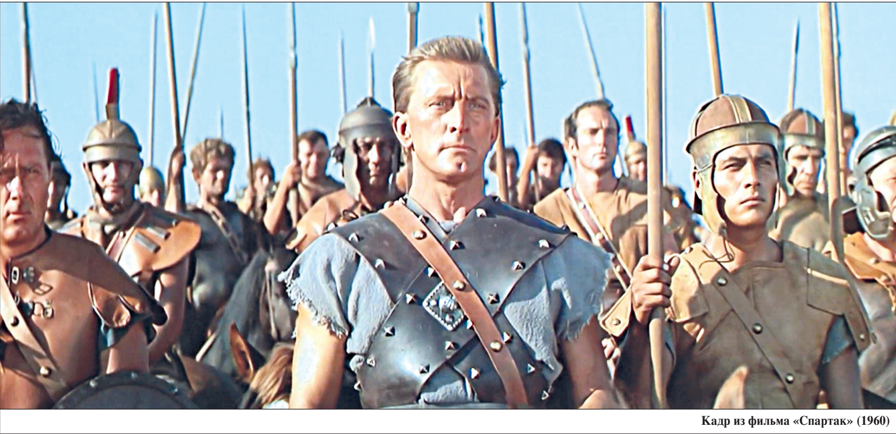
Кадр из фильма «Спартак» (1960)