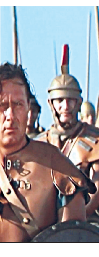
Кадр из фильма «Спартак» (1960)

Роман выходил частями в 1873-74 годах; жестокость рабства, как извращенной формы людских взаимоотношений, не давала покоя писателю, оскорбляя чувство справедливости.