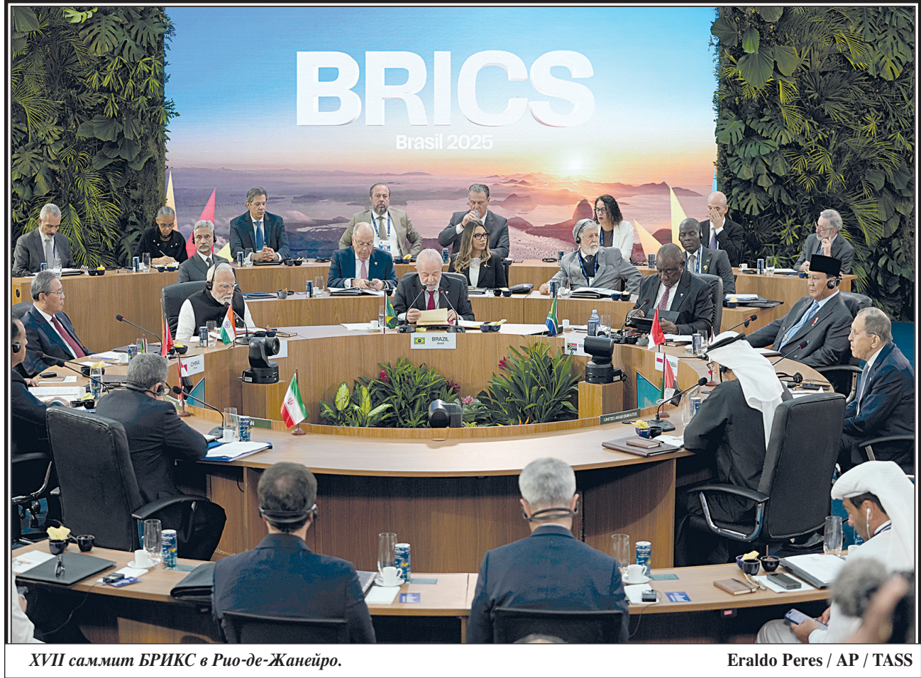
XVII саммит БРИКС в Рио-де-Жанейро.