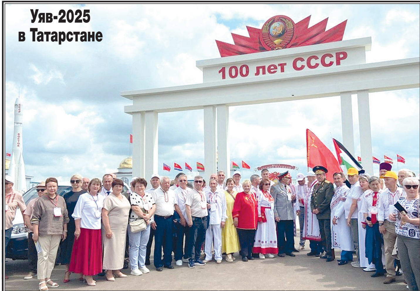
Пресс-служба Самарского обкома КПРФ