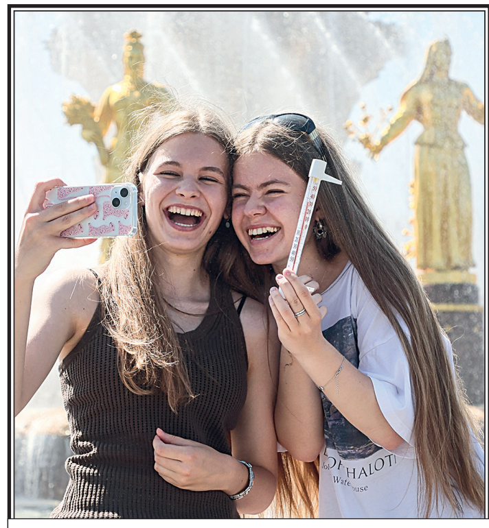
Жаркая погода в Москве.