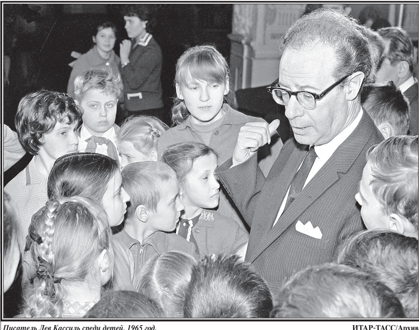
Писатель Лев Кассиль среди детей. 1965 год.

В 1969 году пишет рассказы «Внуки бабушки «Катюши», «Пути знамен». Стройный и подтянутый, Л. Кассиль никогда всерьез не жаловался на здо-