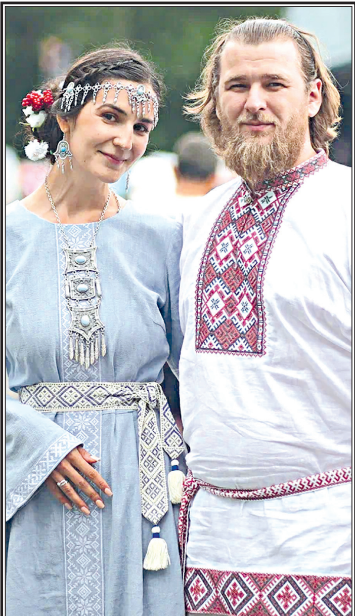
Свадебная регистрация.

Также впервые на фестивале для номинантов этномузыкального конкурса работала Школа творческого проектирования. На лекциях и групповых занятиях участники подняли проблему разрыва между профессиональным и любительским в сфере музыкального фольклора.