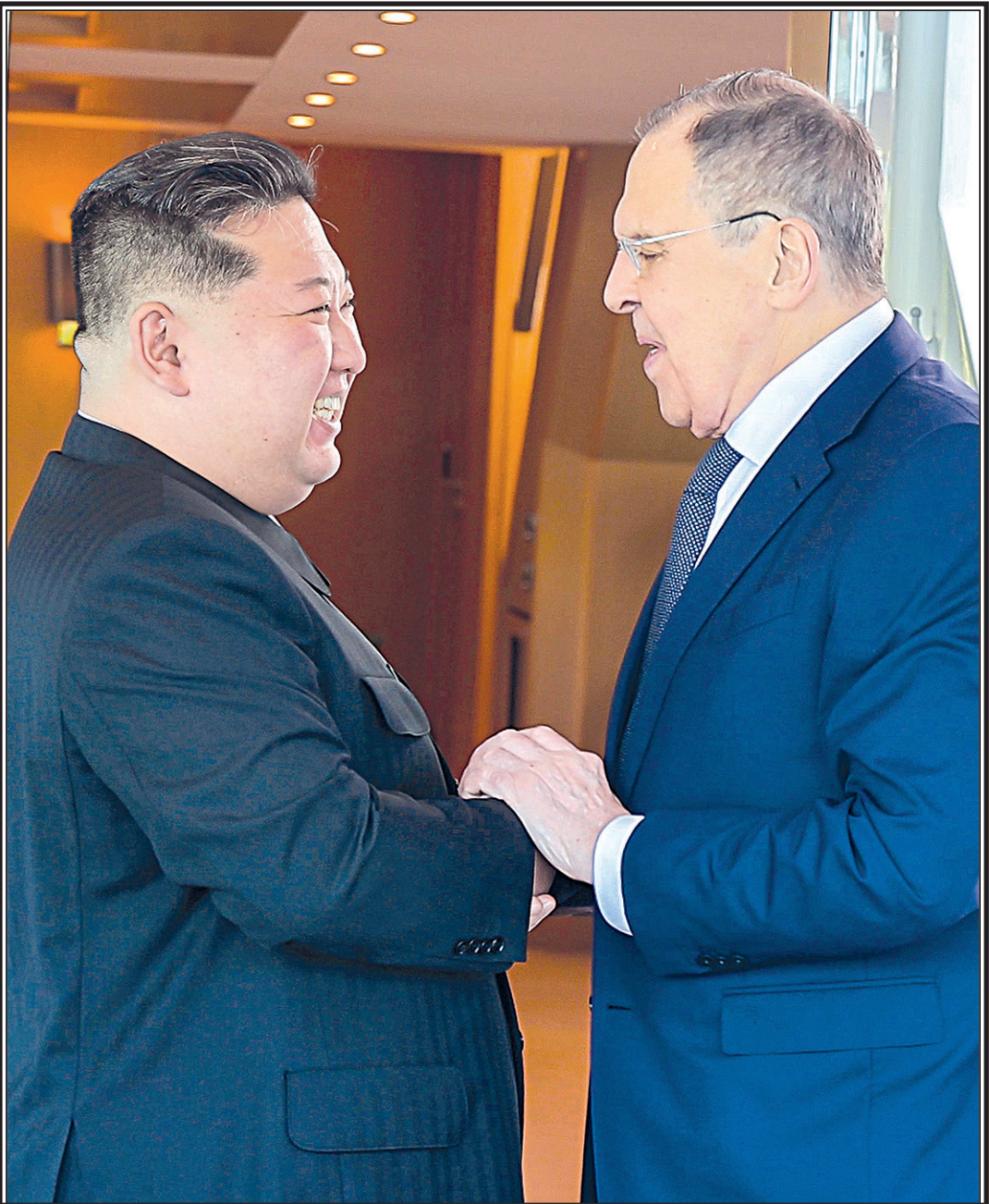
Глава КНДР Ким Чен Ын и министр иностранных дел РФ Сергей Лавров во время встречи в г. Вонсане.

Как отмечается в сообщении российского МИД, беседа Сергея Лаврова и Ким Чен Ына прошла в теплой товарищеской атмосфере.