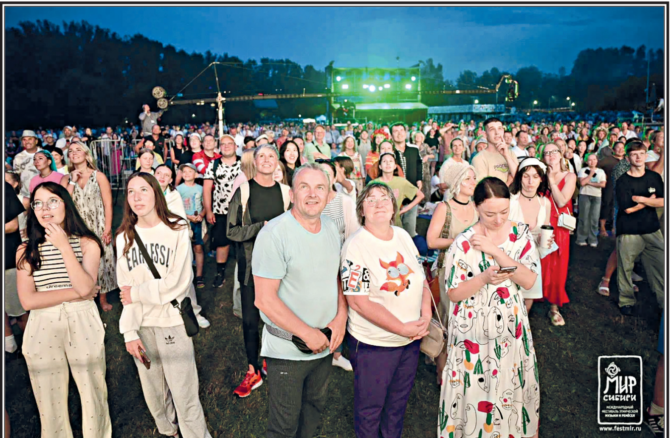
Перед главной сценой.