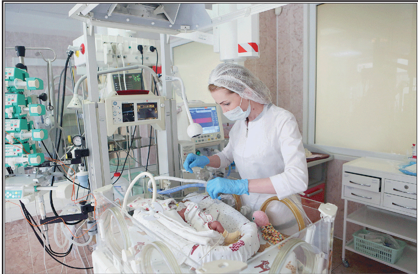
Детская городская клиническая больница № 9 города Москвы