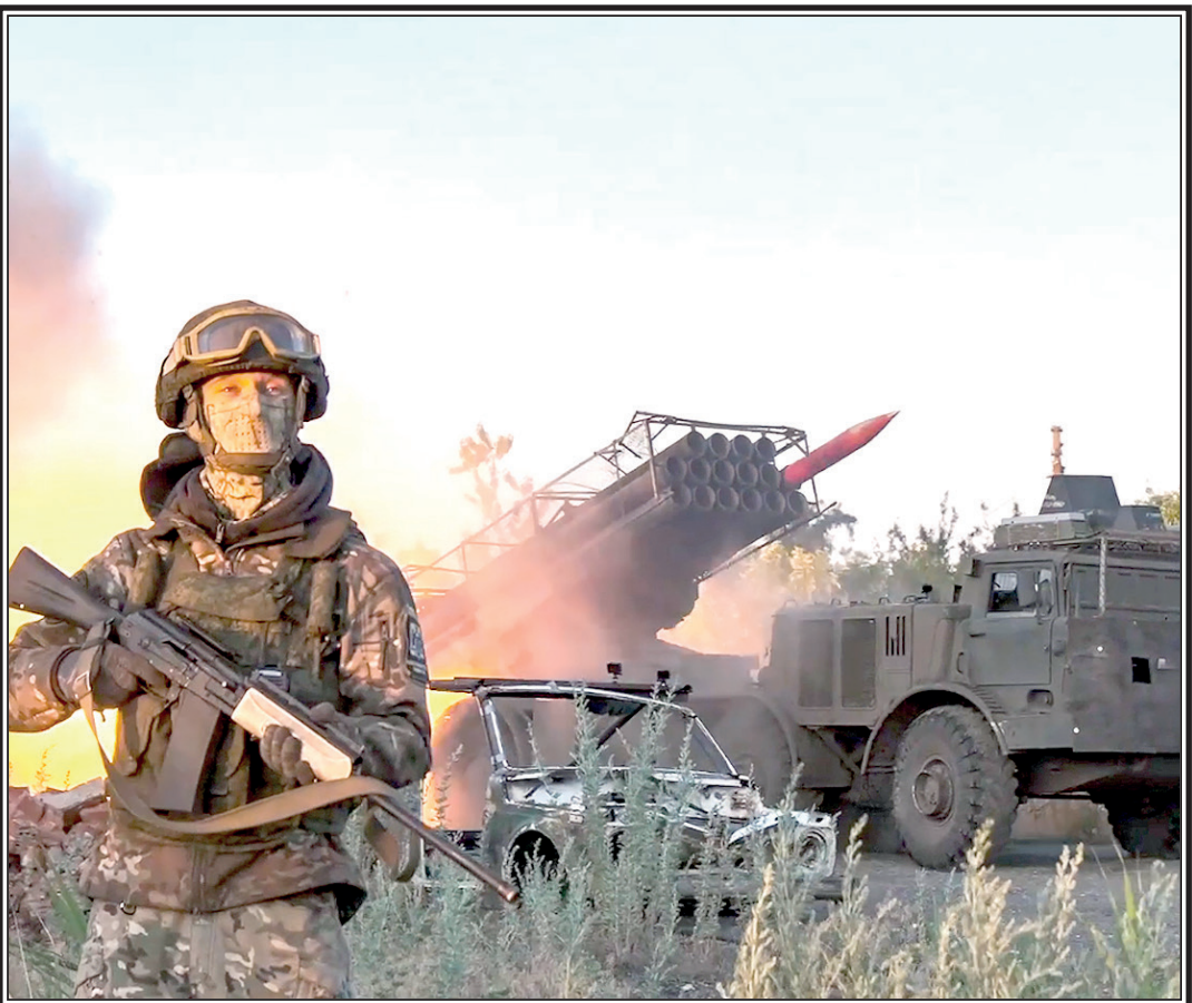
Работа расчета РСЗО «Ураган» в зоне СВО