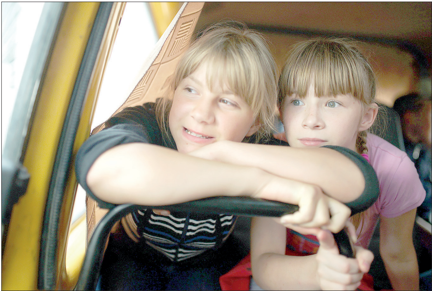
Детдомовцы. Что их ждет?