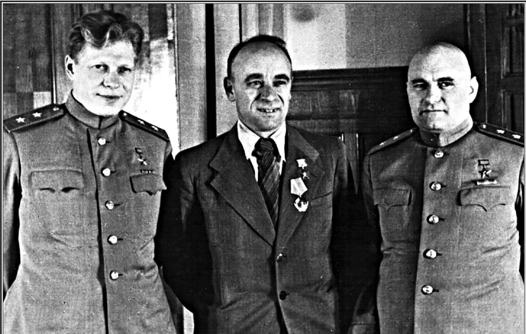
Сталинские наркомы – нарком вооружения СССР Д.Ф. Устинов, нарком танковой промышленности В.А. Малышев и нарком боеприпасов Б.Л. Ванников. Фото 11 августа 1944 года.