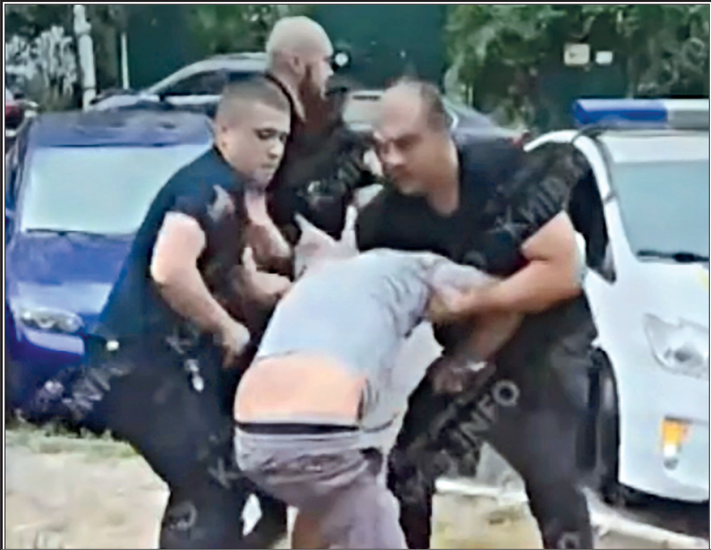
Кадр из эфира Первого канала

Планам западных империалистов расчленил Россию – столетия. Их разработкой во время ВОВ занимался нацистский идеолог Альфред Розенберг, который настаивал на разделении русского народа. Большую часть Великороссии он предлагал присоединить к новому образованию, составленному из Украины, Белоруссии и Дона. Другие территории Московии хотели сделать краем для высылки неугодных Рейху лиц. В Украине Розенберг видел продовольственную колонию. Планам нацистов не суждено было сбыться, для чего та же Украина потеряла 12 млн человек погибшими и неродившимися за годы войны. А урон от разрушений составил 285 млрд рублей – 42% от общего ущерба СССР.