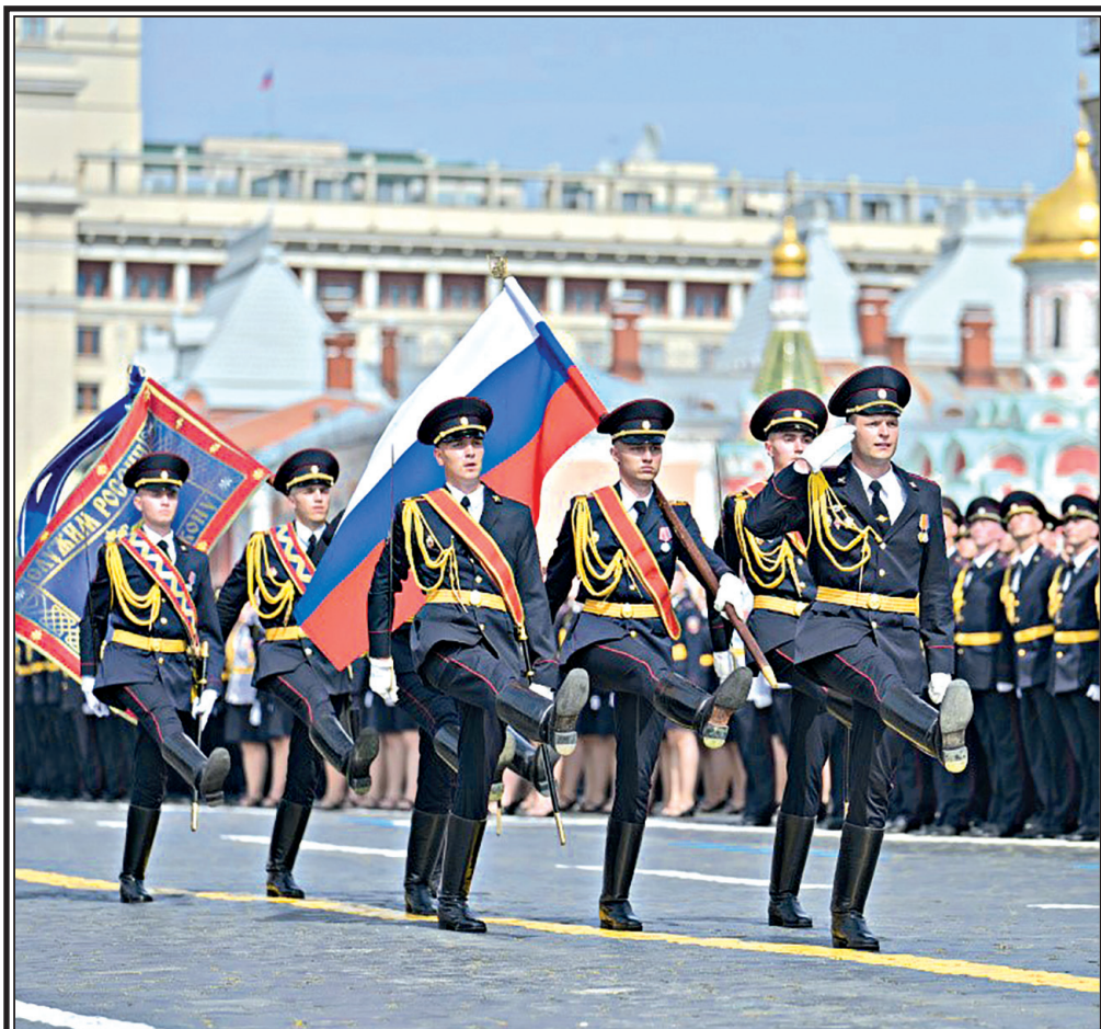
Пресс-центр МВД России