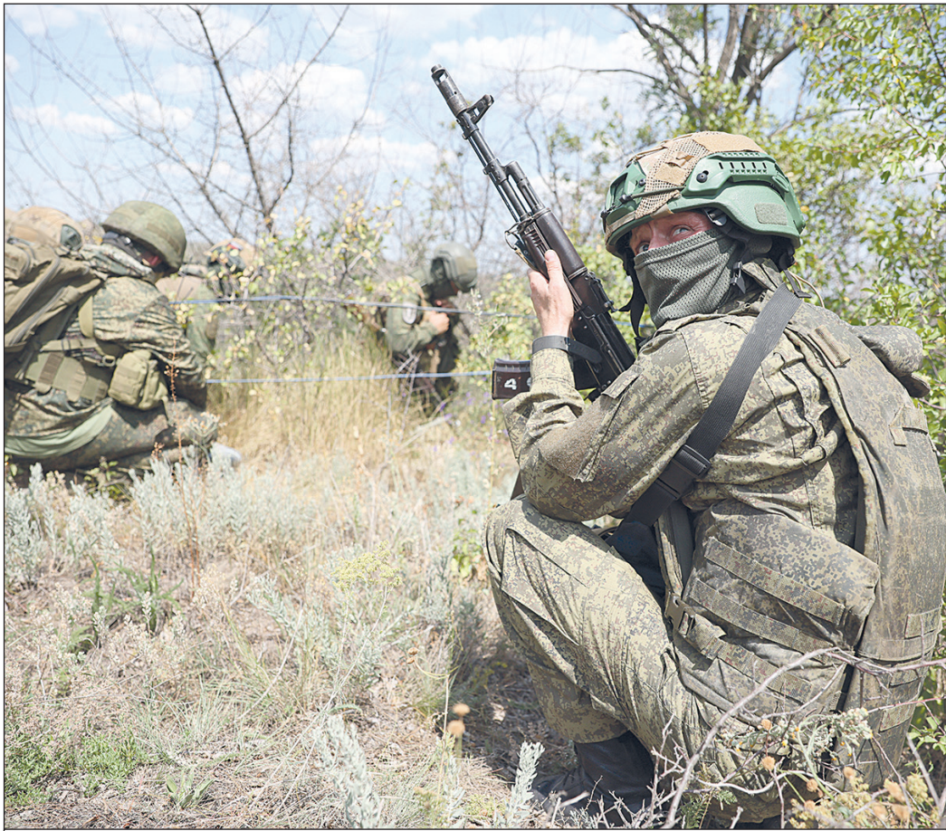
Военнослужащие 7-й отдельной мотострелковой бригады 3-й армии «Южной» группировки войск в зоне проведения СВО.

С начала 90-х экономика Украины последовательно разрушалась, а после разрыва с Россией в 2014 году одичание ускорилося. Если раньше украинская группировка олигархии разбазаривала доставшиеся от СССР национальные богатства, то теперь паны ради собственной власти и обогащения продают Западу последние остатки советской цивилизации – жизни простых украинцев.