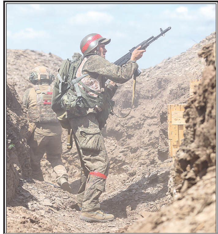
Штурмовики 3-й армии «Южной» группировки войск.

Уважаемые коллеги! Товарищи! Мы, участники Диалога цивилизаций, ставшие гостями Тяньцзиня, уже успели по-настоящему влюбиться в этот прекрасный город. Позвольте поблагодарить организаторов нашего форума, которые сделали все необходимым для его успешного проведения! Желаю успешной работы!