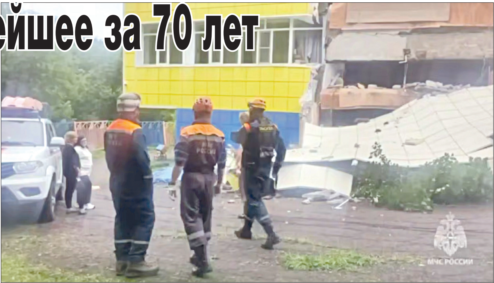
Детский сад №15 в г. Петропавловск-Камчатский.