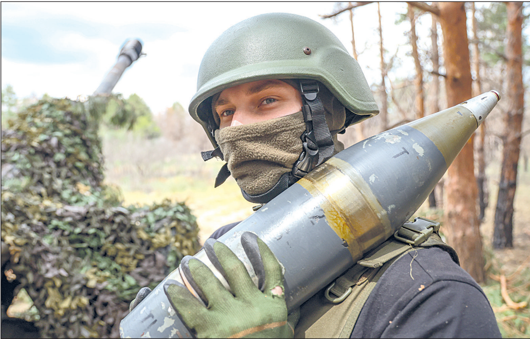
Военнослужащий артиллерийского подразделения 61-й бригады морской пехоты Северного флота в составе группировки войск «Днепр» во время боевой работы расчета 122-мм гаубицы Д-30 в зоне СВО.