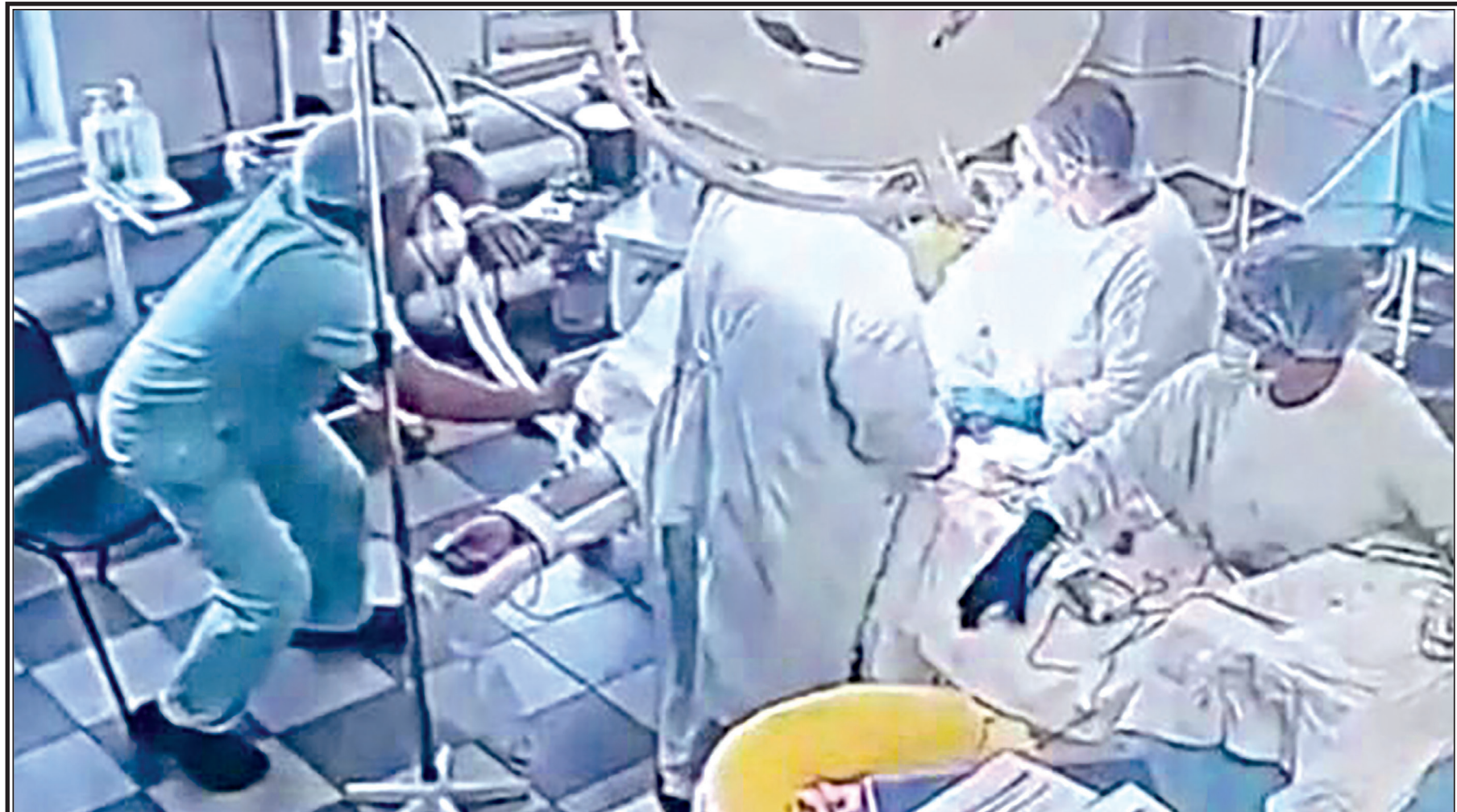
Хирургическая операция во время землетрясения.