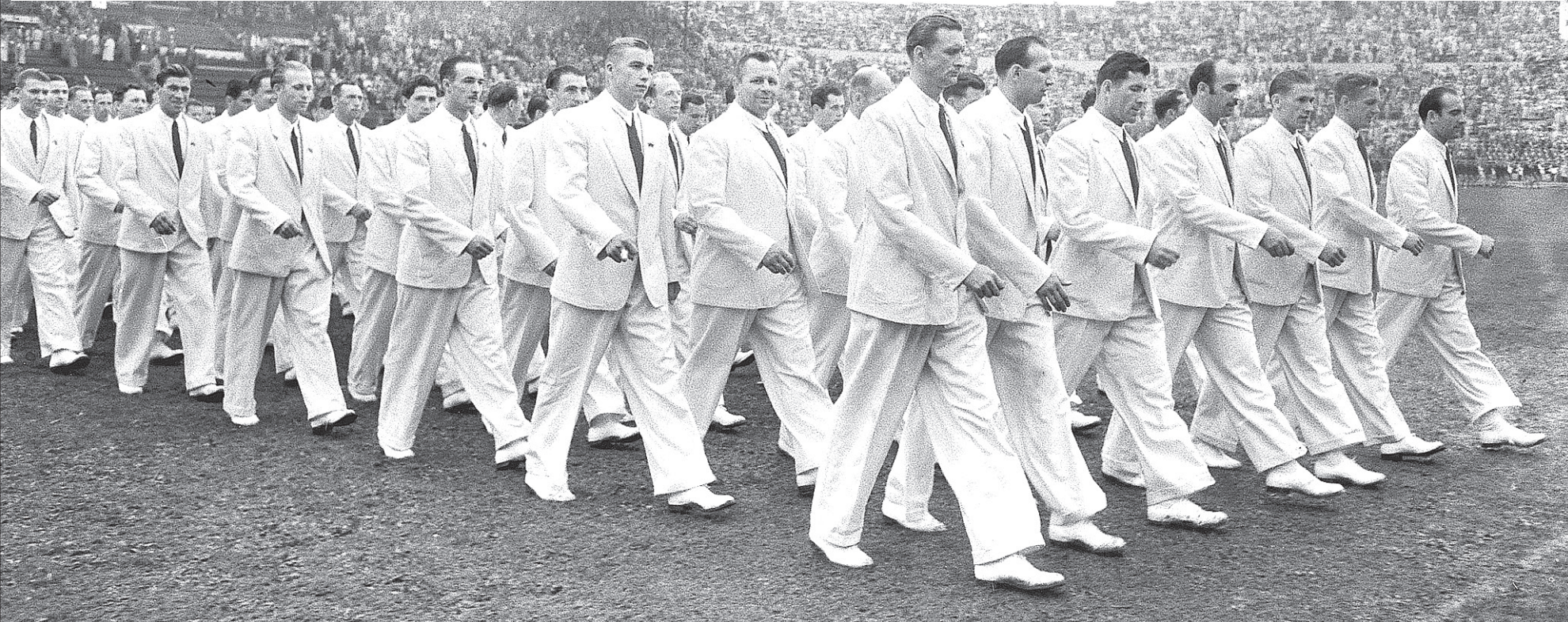
На открытии XV летних Олимпийских игр.