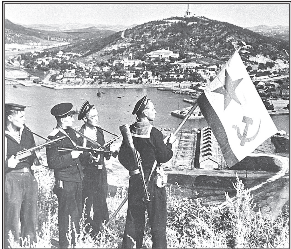
Порт-Артур. Моряки Тихоокеанского флота в освобожденном от японских оккупантов городе.