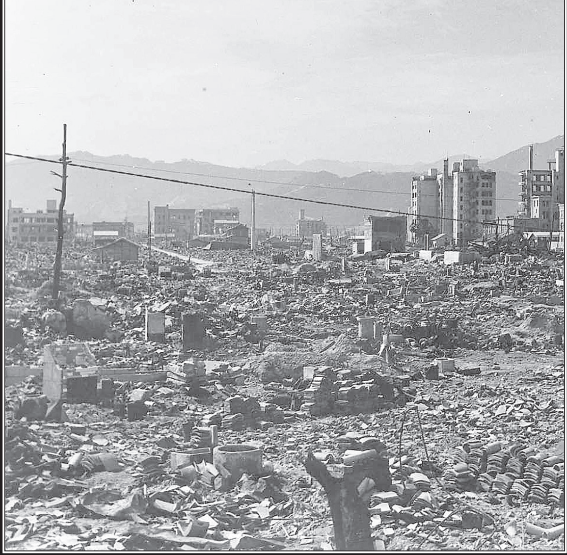
Хиросима после ядерного взрыва мощностью 15 килотонн.