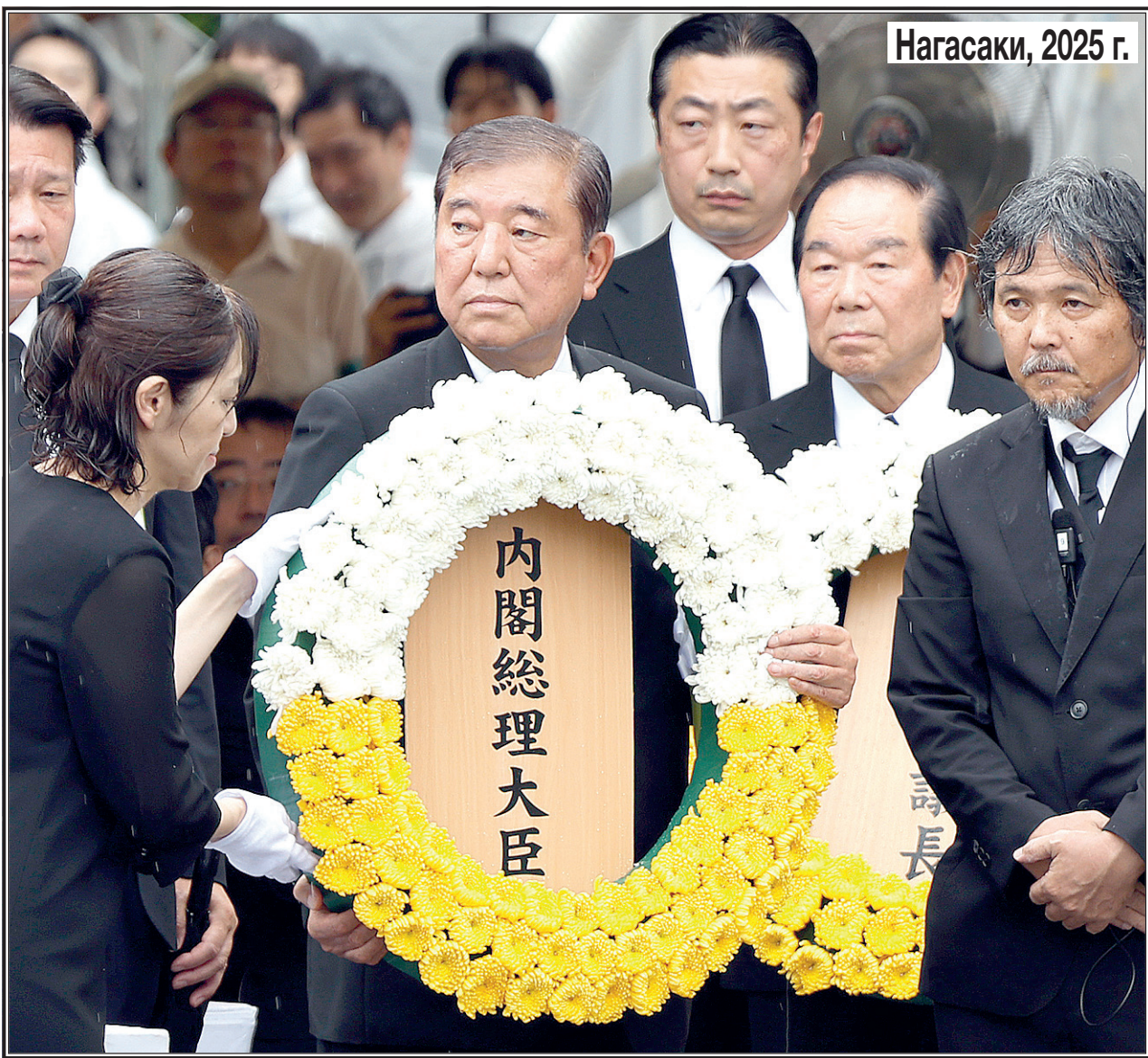
Памятные мероприятия в Нагасаки, 9 августа 2025 г.