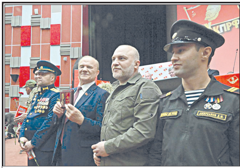
К пленумам и собраниям КПРФ бойцы СВО проявляют живой интерес.